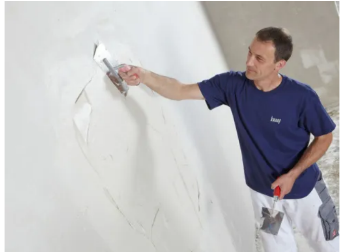
Hochwertige Putzflächen, fertig an einem Tag: Knauf Rotband Sprint - Gipsputz mit Sprinteigenschaften

Knauf Rotband Sprint | Broschüre Rotband Sprint