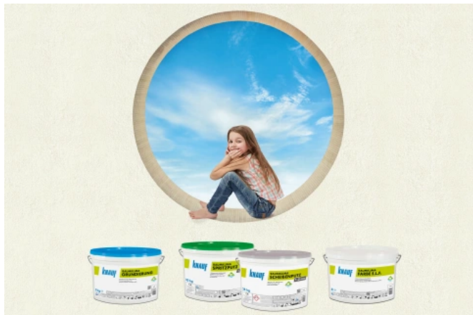
Egal ob der geglättete Gipsputz nur mit Farbe gestrichen werden soll oder ein Oberputz gewünscht ist: Die perfekte diffusionsoffene Beschichtung erfolgt mit Knauf Raumklima-Produkten.