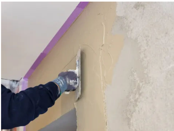
Von der Untergrundvorbereitung zur fertig verputzten Wand an einem Tag: Knauf Universal-Feinspachtel Sprint

Von der Untergrundvorbereitung zur fertig verputzten Wand an einem Tag