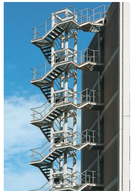
Objekt „Verwaltungsgebäude Stuttgart“

Stahltrappe als Fluchttreppe mit vier Austritts- und neun Zwischenpodesten. Konstruktion mit Flachstahlwangen und dazwischen verschraubten Gitterrosttritten. Tragkonstruktion mit mittig angeordneten Quadratrohrstützen, Geländer als Stahlstabgeländer. Geländerfüllung aus senkrechten Rundstäben zwischen Handlauf und Untergurt verschweißt. Handlauf als Rohrhandlauf. Alle Stahlteile feuerverzinkt.