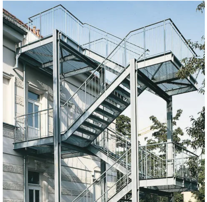
Objekt „Schule Berlin“

Stahltrappe als Fluchttreppe mit vier Austrittspodesten und vier Zwischenpodesten. Treppentragkonstruktion mit am Gebäude eingespannten Außenwangen und dazwischen verschraubten Gitterrosttritten. Konstruktion statisch ohne zusätzliche senkrechte Stützen. Gurtgeländer mit Rundrohrpfosten, einem Rohrhandlauf und drei Rundrohrkniegurten auf den Außenwangen verschraubt. Alle Stahlteile feuerverzinkt.