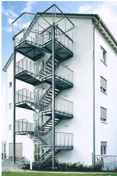
Objekt „Altenheim Mannheim“

Aus der Serie SPRENG-Stahltreppen als Systemtreppen von SPRENG