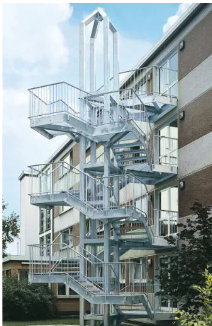
Objekt „Krankenhaus Berlin“

Stahltrappe als Fluchttreppe über vier Geschosse mit vier Austritts- und vier Zwischenpodesten. Außenwangen aus Profilstahl mit eingeschraubten Gitterrosttritten. Tragkonstruktion als senkrechte Profilstahlträger an der Treppenaußenseite. Stahlstabgeländer mit Rundrohrpfosten an Außenwange verschraubt. Geländerfüllung aus senkrechten Rundstahlstäben. Rohrhandlauf. Alle Stahlteile feuerverzinkt.