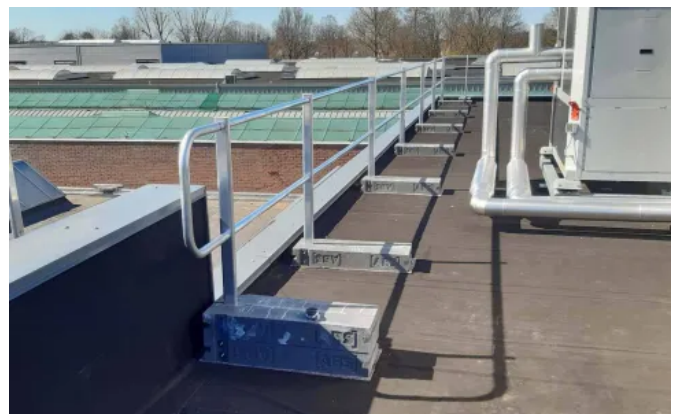
Das Schutzgeländer ABS Guard OnTop Weight ist für die durchdringungsfreie Montage per Auflast konzipiert.