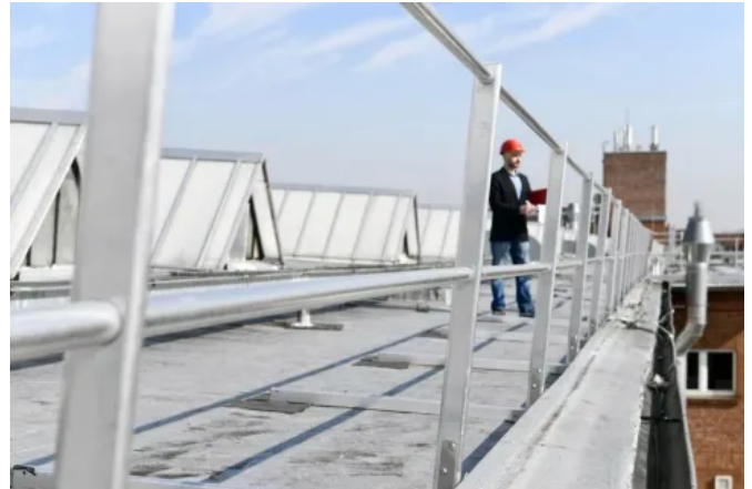
Das Schutzgeländer ABS Guard OnTop Weight ist für die durchdringungsfreie Montage durch Verschweißen auf der Flachdach-Abdichtung konzipiert.