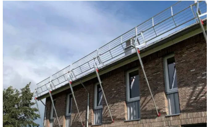
Das temporäre Schutzgeländer ABS Mobile Guard – pitched kommt ohne Auflast aus.