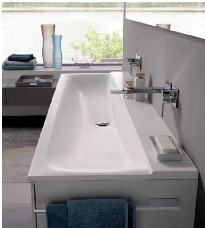
Waschtisch aus Mineralwerkstoff Varicor ®

Geberit Xeno 2 Waschtische aus dem Mineralwerkstoff Varicor ® zeichnen sich durch die schlank umlaufende Slim Rim Kante aus. Zusammen mit passenden Badmöbeln lassen sich exklusive, großzügige Badeinrichtungen mit leicht anmutenden Waschplätzen realisieren. Spannende Details wie eine integrierte Lichtleiste unter dem Waschtisch setzen interessante Akzente.