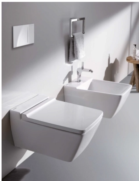
WC und Bidet mit pflegeleichten Außenflächen, viel Bodenfreiheit und verdecktem Befestigungssystem