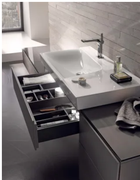
Geräumige Schubladen und Auszüge