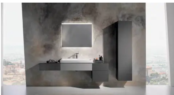
Xeno 2 Waschplatz mit Lichtspiegel