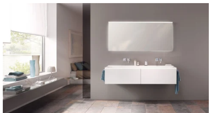
Xeno 2 Möbelfronten in Weiß Lack Hochglanz