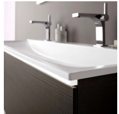
Xeno 2 Detail