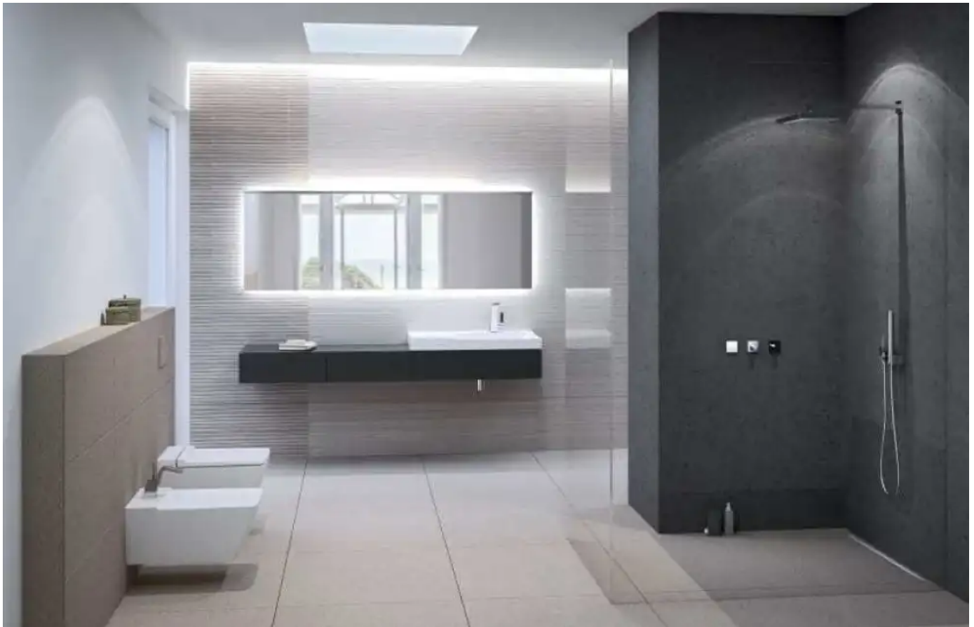
Geberit Xeno 2 mit einheitlicher Formensprache von Waschtisch, Badmöbel, WC und Bidet.