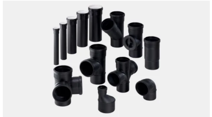
Geberit Silent-PP Abwasser-Stecksystem mit erhöhtem Schallschutz

Silent-PP Rohre und Formstücke sind unter der Zulassungsnummer Z-42.1-432 vom DIBt bauaufsichtlich zugelassen. Das System darf nicht druckbelastet werden und darf daher auch nicht für Dachentwässerung mit Druckströmung (Pluvia) verwendet werden.