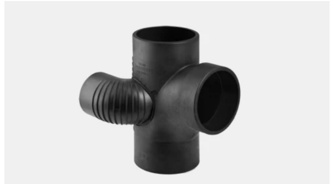
Sonderformstücke wie der Geberit Silent-db20 Schachtbogenabzweig bieten Planern und Installateuren Spielraum für eine optimale Leitungsplanung