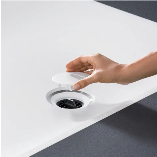
Die Abdeckung über Abfluss und Haarkamm ist mit einem Handgriff abnehmbar.

Aus der Serie Lösungen für bodenebene Duschen von Geberit