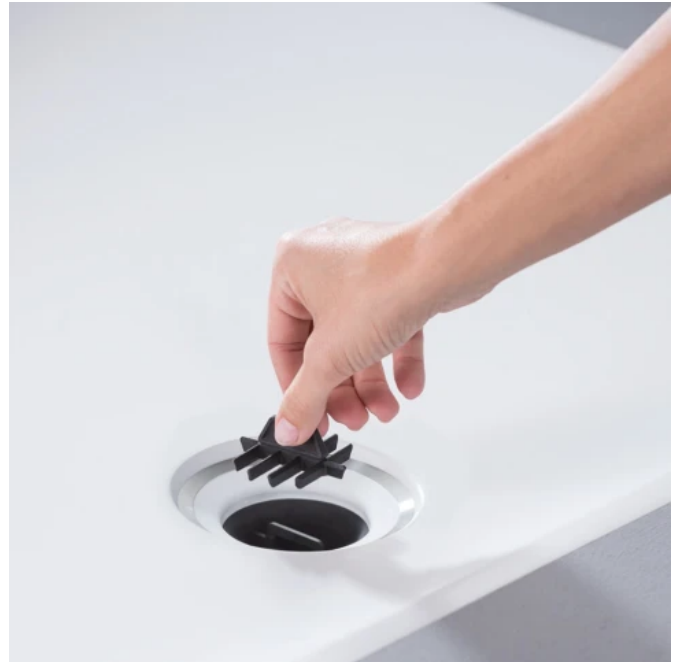
Unter der Ablaufabdeckung befindet sich wie bei anderen Geberit Modellen ein entnehmbare Kammeinsatz, der einfach zu reinigen ist und Verstopfungen verhindert.

Bei der Verwendung von Geberit Duschabläufen wird die Reinigung durch einen Kammeinsatz erleichtert. Unterhalb des Ablaufdeckels befestigt, lässt er sich mit einem einfachen Handgriff entfernen und von Rückständen befreien. Auch die Duschfläche lässt sich sehr leicht reinigen. Es gibt keine verdeckten Kanten, an denen sich Schmutz oder Ablagerungen ansammeln können. Dadurch kann die Duschfläche unterbrechungsfrei zusammen mit dem Fußboden gewischt werden.