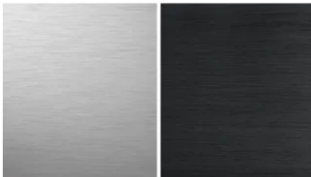
Geberit Monolith Seitenverkleidungen in Aluminium gebürstet und Aluminium schwarzchrom

Die Frontverkleidungen lassen sich wie folgt mit den beiden Seitenverkleidungen Aluminium gebürstet und Aluminium schwarzchrom kombinieren: