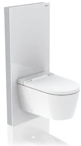
Geberit Monolith Sanitärmodul

Im Neu- und Umbau ermöglichen die Geberit Monolith Sanitärmodule mehr Freiheit in der Gestaltung und Aufteilung der Sanitärräume und in der Wahl der Wandmaterialien. Die modernen Materialien eröffnen neue Möglichkeiten in der Raumgestaltung und bieten durch die variable Positionierung der Sanitärobjekte zusätzlichen Gestaltungsspielraum. Um optimal auf unterschiedliche bauliche Gegebenheiten eingehen zu können, ist das Sanitärmodul in den Bauhöhen 101 und 114 cm erhältlich sowie für Stand-WCs und wandhängende Keramiken.