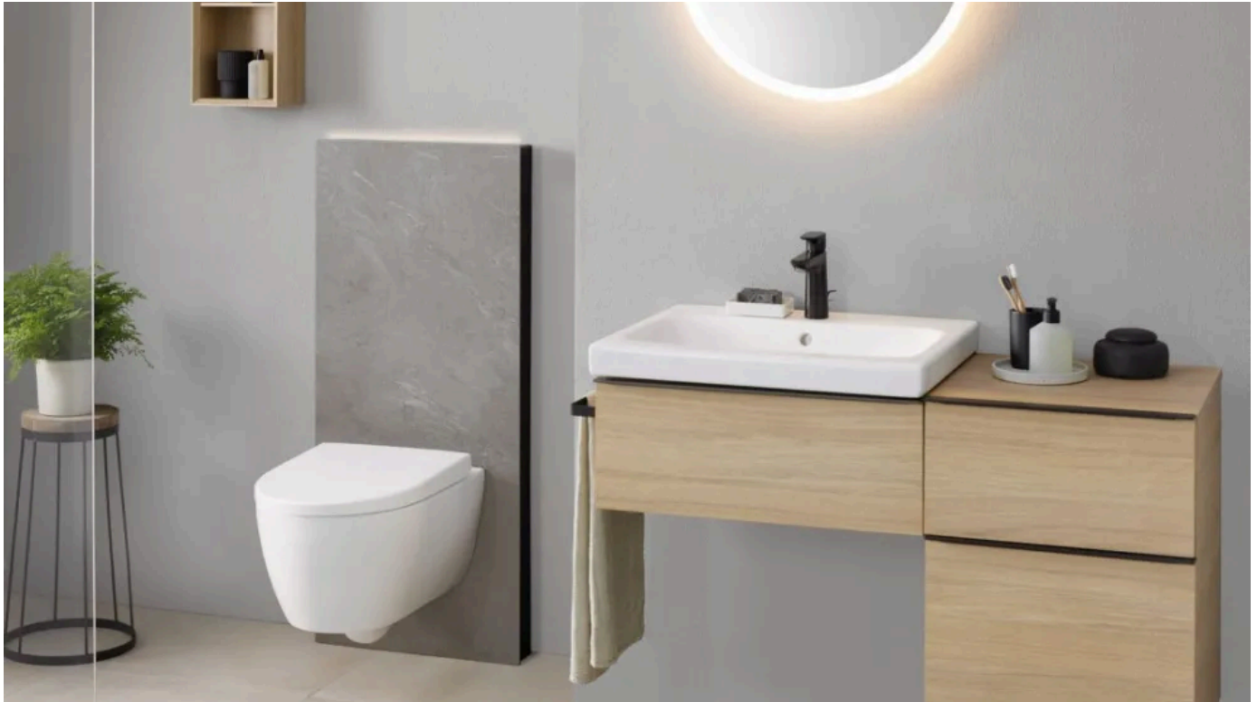
Sanitärmodul Monolith mit Frontverkleidung Steinzeug Betonoptik

Aus der Serie Installationssysteme und Spülkästen von Geberit