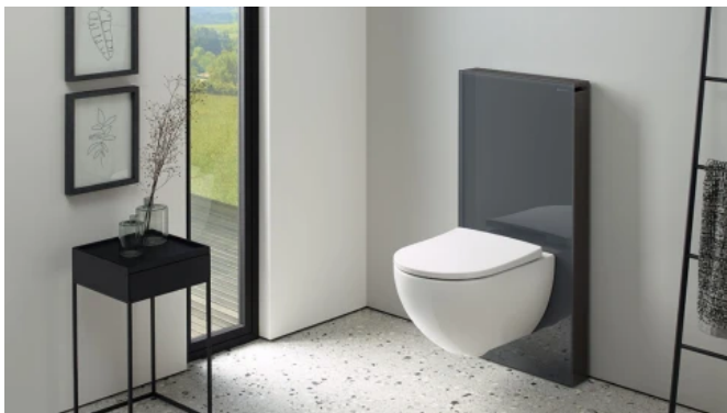
Sanitärmodul Monolith mit Frontverkleidung Glas lava