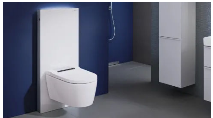
Sanitärmodul Monolith mit Frontverkleidung Glas weiß