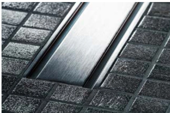
Geberit CleanLine60 gibt es für flachen Fliesen auch mit einem flacher ausgeführten Profil.