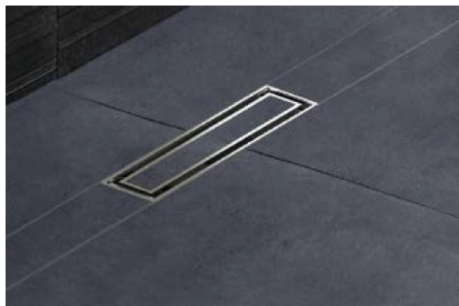
Geberit CleanLine mit befliesbarer Abdeckung.