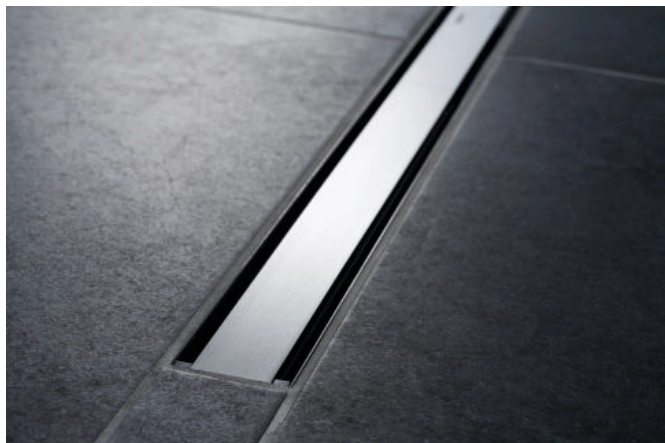
Flach und diskret: Das Modell Geberit CleanLine60 schließt bündig mit der Bodenfläche ab.

Aus der Serie Lösungen für bodenebene Duschen von Geberit