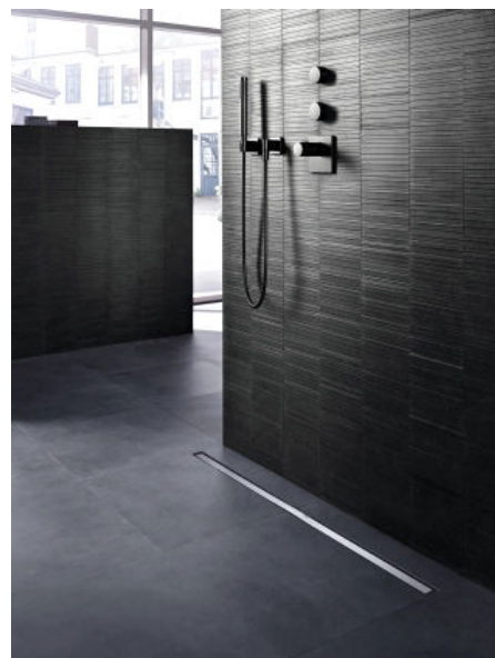
Die Duschrinne Geberit CleanLine lässt sich optimal auf die Größe des Duschplatzes anpassen.