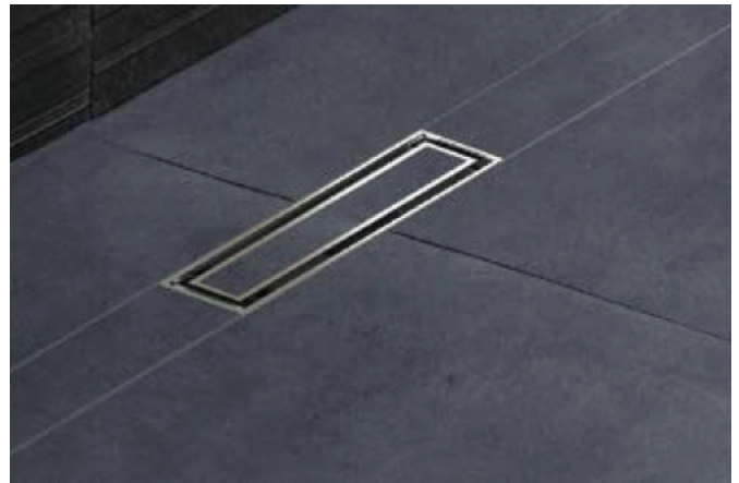
Geberit CleanLine mit befließbarer Abdeckung.