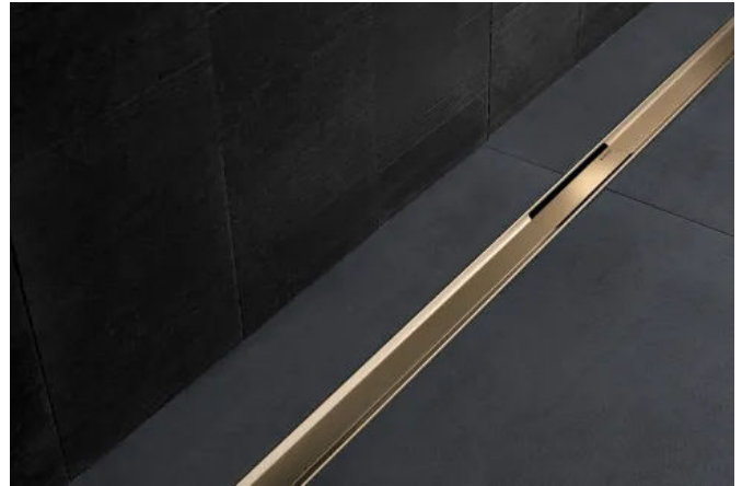
Die Geberit Duschrinne Cleanline80 mit integriertem Gefälle ist unter anderem in den Farben champagne und schwarzchrom erhältlich.