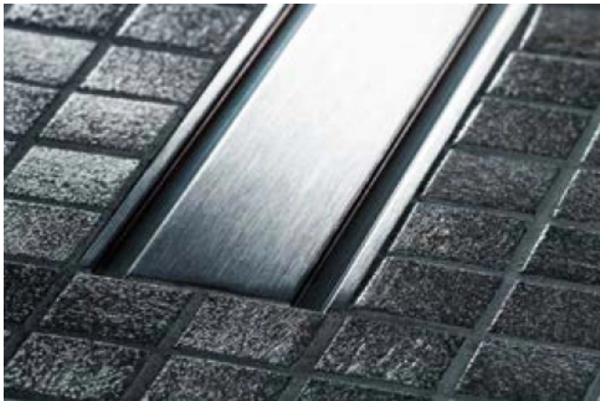
Geberit CleanLine60 gibt es für flachen Fliesen auch mit einem flacher ausgeführten Profil.