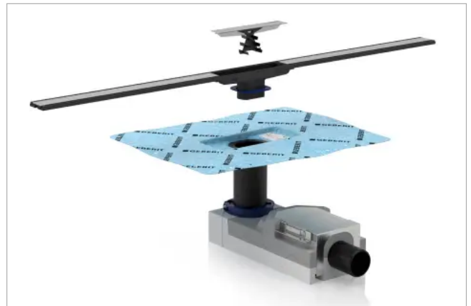
Dauerhaft und sicher: Eine werkseitig vormontierte Dichtfolie sorgt für eine fehlerfreie und sichere Abdichtung der Duschrinne.

Die dauerhaft dichte Abdichtung ist eine große Herausforderung bei bodenebenen Duschen. Geberit bietet hier eine einfache und effiziente Lösung: Eine werkseitig vormontierte Dichtfolie, die auf dem Ablauf eingespritzt ist, sorgt für eine fehlerfreie und sichere Abdichtung der Duschrinne. Der Fliesenleger sorgt dann für eine vollständige Einbindung in die Abdichtung. Geberit hat die Duschrinne mit verschiedenen Dichtsystemen in unterschiedlichen Bausituationen geprüft, das gibt zusätzliche Sicherheit für Planer und Handwerker.