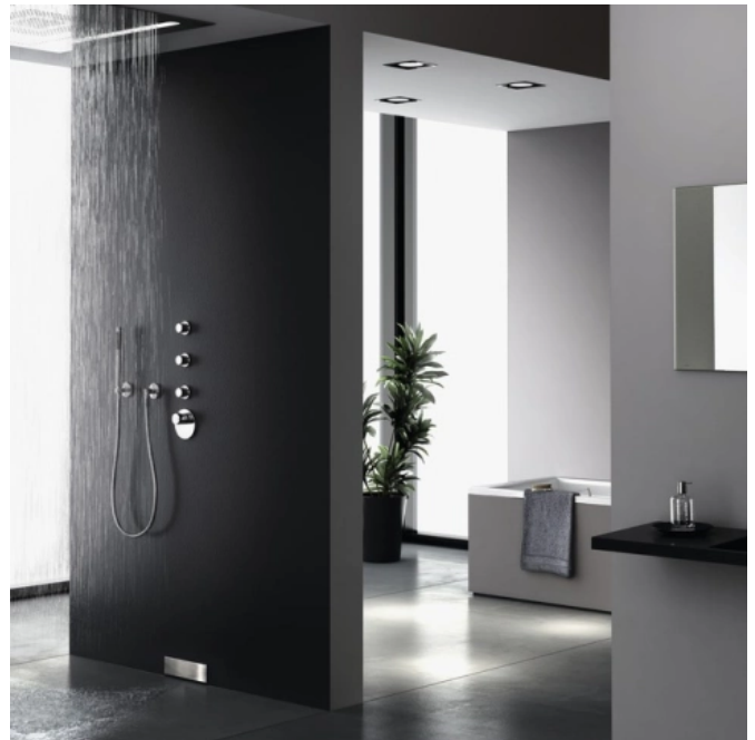
Geberit CleanWall Wandablauf

Die Montage ist einfach und schnell. Die Arbeitsschritte der einzelnen Gewerke sind klar voneinander getrennt. Boden- und Wandabdichtung lassen sich dank der integrierten Dichtungsanbindung einfach herzustellen.