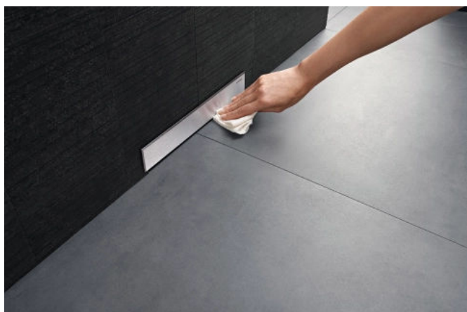
Der Wandablauf lässt sich einfach sauber halten.

Vorhandene Installationsebenen können in der Regel genutzt werden. Die Elemente sind mit vorinstallierten flexiblen Anbindungen zur Abdichtung im Verbund ausgestattet. Die Schnittstellen zwischen verschiedenen Gewerken sind sauber definiert und gelöst. Durch die Verlegung des Wasserablaufs vom Boden in die Vorwandinstallation gestaltet sich der Bodenaufbau deutlich einfacher. Die Sanitärinstallation unterbricht nicht mehr die Trittschall- und Wärmedämmung. Fußbodenheizungen können unterbrechungsfrei unter dem Boden der Dusche verlegt werden. Minimale Estrichüberdeckungen der Abwasserrohre sind nicht mehr zu beachten, da unterhalb der Dusche keine Entwässerung mehr verläuft.