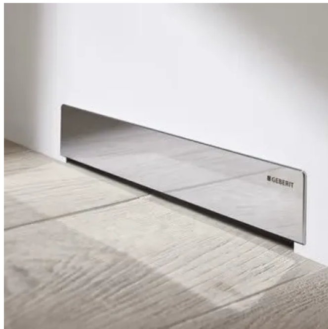
Geberit CleanWall Wandablauf mit glanzverchromter Abdeckung