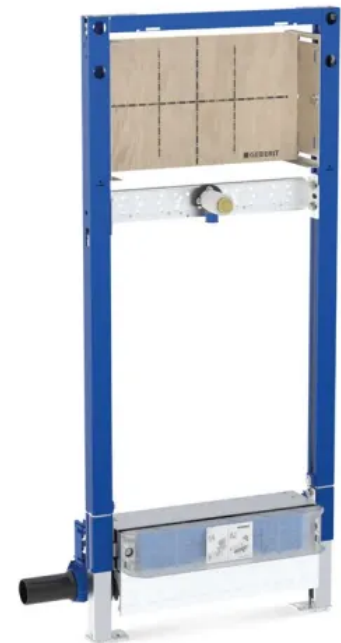
Geberit CleanWall Duschelement

Der Siphon mit der normgerechten Sperrwasserhöhe von 50 mm überzeugt durch eine hohe Ablaufleistung von 0,85 l/s. Die Geberit Duschelemente wurden im Gesamtsystem und in unterschiedlichen Bausituationen geprüft. Das garantiert umfassende Sicherheit aus einer Hand. Wie in der DIN 4109 gefordert, betrachten die Schallschutznachweise die gesamte Wasserinstallation mit der Ver- und Entsorgung. Sie umfassen eine Vielzahl baulicher Begebenheiten und erfüllen in vielen Bausituationen auch die erhöhten Anforderungen nach VDI 4100. Weiterhin bietet Geberit auch zahlreiche Brandschutznachweise für die Duschelemente.