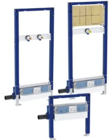
Geberit Duofix Duschelemente mit CleanWall Wandablauf: für Aufputzarmatur, für Unterputzarmatur und ohne Armatur.

Die Geberit Duofix CleanWall Elemente gibt es als Variante für Unterputz- sowie für Aufputz-Armaturen. Beide sind für teilhohe und raumhohe Installationswände geeignet. Zusätzlich steht ein niedriges Trockenbauelement zum Einbau in Installationswände zur Verfügung. Für Dusch- und Badewannen bietet Geberit zusätzlich Installationselemente und Traversen für Aufputz- und Unterputzarmaturen ohne Wandablauf.