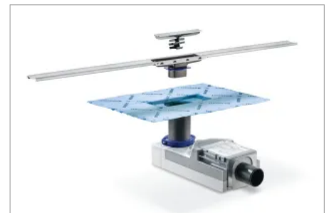
Dauerhaft und sicher: Eine werkseitig vormontierte Dichtfolie sorgt für eine fehlerfreie und sichere Abdichtung der Duschrinne.

Der Fliesenleger sorgt dann für eine vollständige Einbindung in die Abdichtung. Geberit hat die Duschrinne mit verschiedenen Dichtsystemen in unterschiedlichen Bausituationen geprüft, das gibt zusätzliche Sicherheit für Planer und Handwerker.