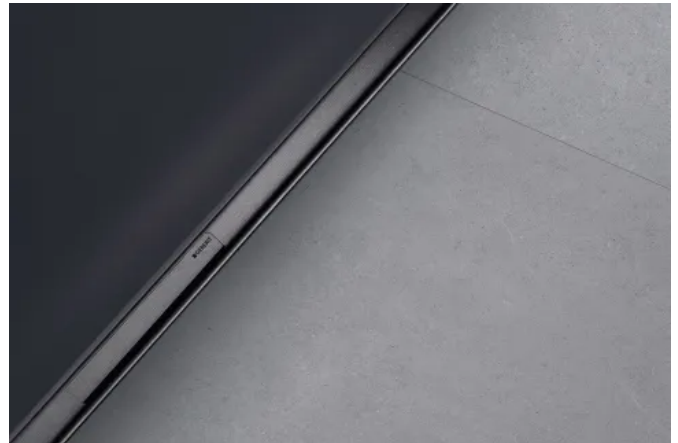
Die Geberit CleanLine50 wird mit einer schmalen Profildicke für minimalistische Gestaltungen eingesetzt.