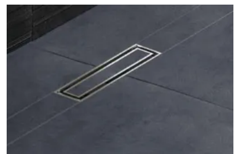
Geberit CleanLine mit befliessbarer Abdeckung.