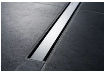
Flach und diskret: Das Modell Geberit CleanLine60 schließt bündig mit der Bodenfläche ab.