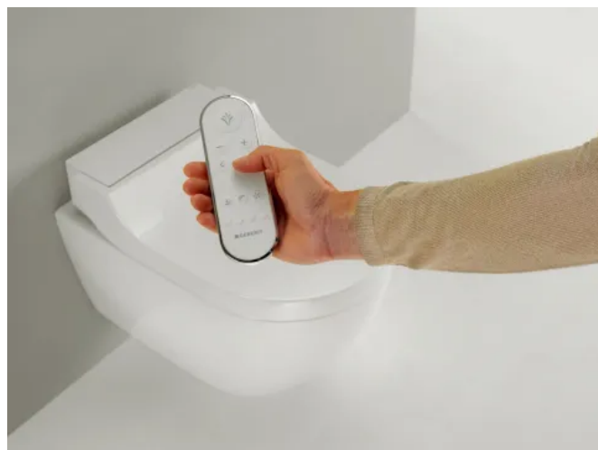
Fernbedienung für AquaClean Tuma Comfort

Geberit AquaClean Tuma wird mittels einer übersichtlichen und handlichen Fernbedienung aktiviert. Sie ist im Lieferumfang inbegriffen.