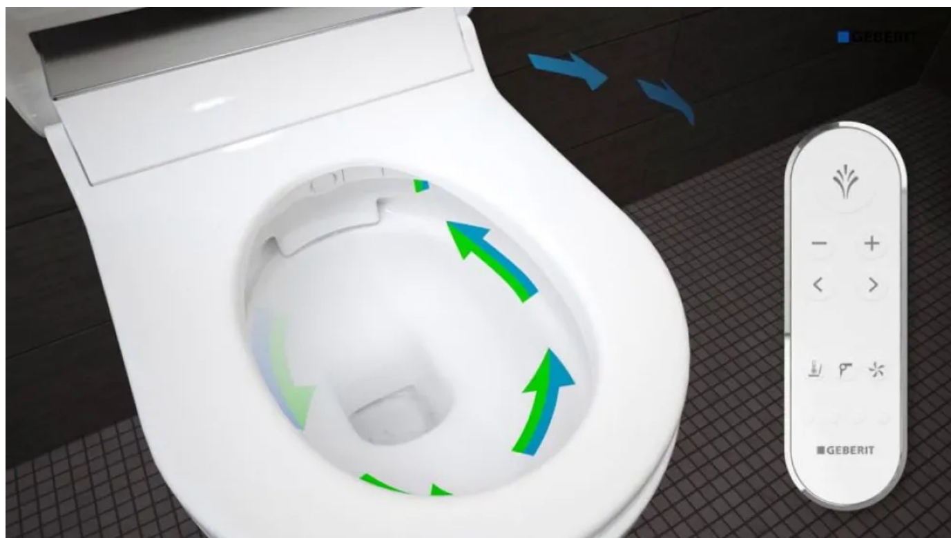
So funktioniert das Geberit AquaClean Tuma

Geberit AquaClean Tuma wurde mit dem Designpreis iF Design Award 2017 ausgezeichnet.