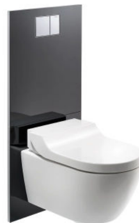
AquaClean Tuma mit Designplatte

Die Designplatte macht es möglich, den Wasseranschluss eines Geberit AquaClean Dusch-WCs ohne Eingriff in vorhandene Fliesen verdeckt zu verlegen. Sie ist erhältlich für Komplettanlagen und Aufsatzgeräte.