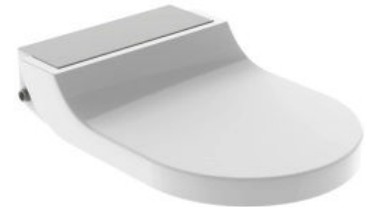
Der Geberit AquaClean Tuma WC-Aufsatz passt zu den meisten Sanitärkeramiken

Der WC-Aufsatz zum Nachrüsten lässt sich problemlos auf verschiedene vorhandene WC-Keramiken montieren und kann so einfach nachgerüstet werden. Dafür benötigt der Nutzer lediglich einen Strom- und Wasseranschluss sowie einen kompatiblen Spülkasten. Der Aufsatz ist in vier verschiedenen Designabdeckungen erhältlich: Edelstahl gebürstet, Glas schwarz, Glas weiß und weiß-alpin.