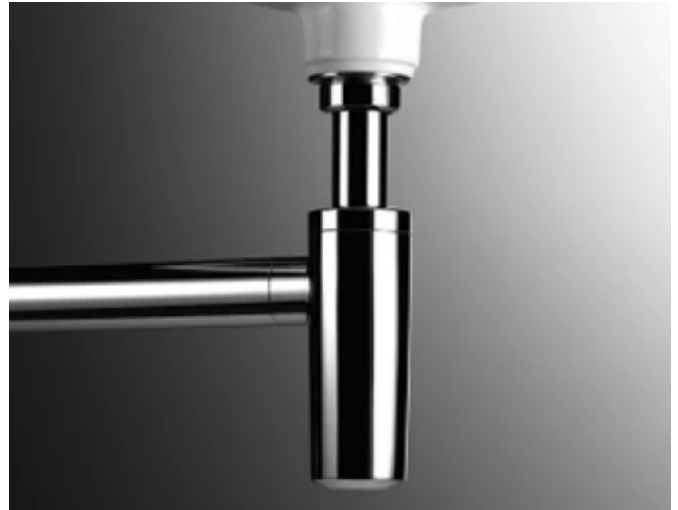
Waschbeckenablauf mit Siphon