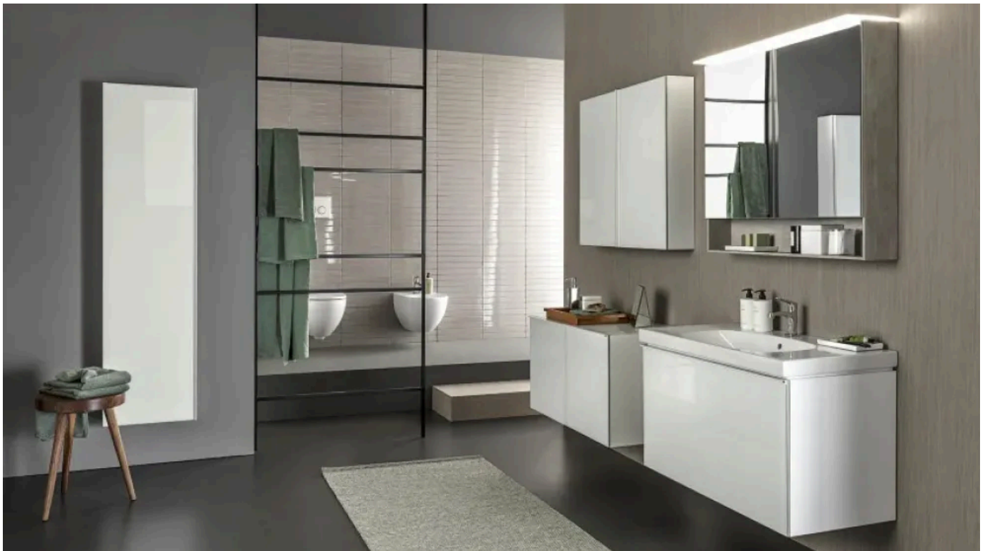
Badserie Geberit Acanto