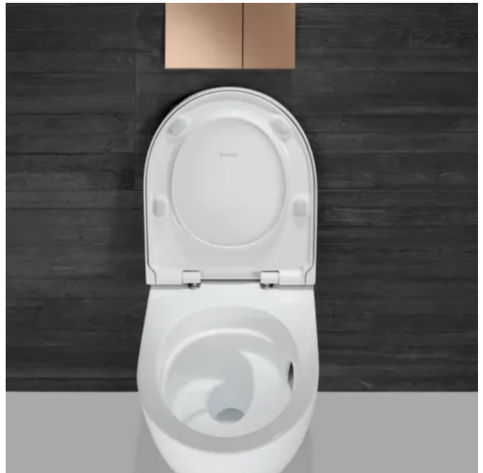
Die Lenkung des Wassers beim Spülvorgang wird durch Neuerungen präzise beeinflusst, dass eine gründlichere und leisere Ausspülung erreicht wird.

Für den Boden der Keramik wurde eine wasserleitende Kante entwickelt, die den Wasserstrudel so lenkt, dass ein Teil davon direkt in den Siphon geleitet wird. Dies verhindert, dass im Inneren des Wasserstrudels ein Hohlraum entsteht und leichte Rückstände wie beispielsweise Toilettenpapier nicht restlos weggespült werden. Die Kante nutzt den Schwung des Wassers und sorgt dafür, dass auch das Zentrum des Wasserstrudels ausgespült wird.