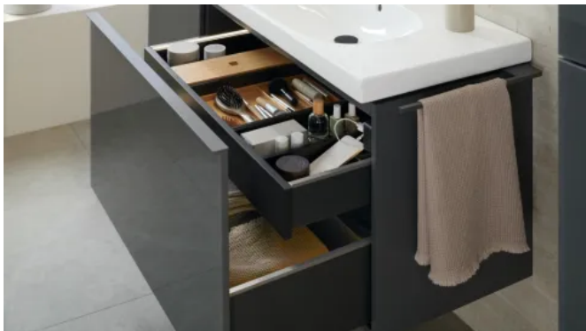
Alle Schubladen besitzen eine durchgehende Staufläche, da auf den Siphon-Ausschnitt verzichtet werden konnte. Dies sorgt in der oberen Schublade für noch mehr Stauraum.