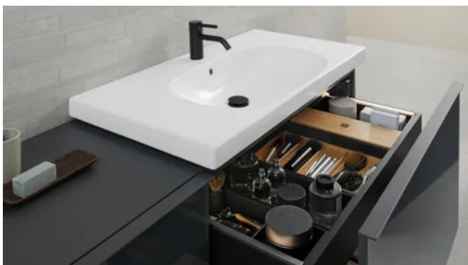
Geberit Acanto Waschtisch im zeitlos modernen Soft-Organic-Design mit klarer geometrischer Kontur und organisch geformtem Innenbecken.