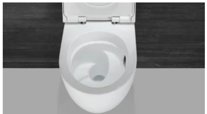
Geberit Acanto WC mit TurboFlush-Spültechnik und QuickRelease-Scharnier für eine schnelle und einfache Reinigung.