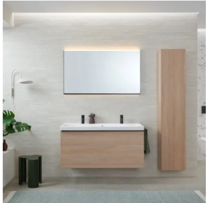
Neben zwei Glasoberflächen in Weiß und Lava sind Möbelloberflächen in Weiß glanz, Weiß matt, Lava matt sowie Melamin Eiche und Nussbaum im Acanto Sortiment.