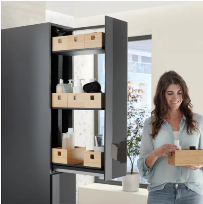
Acanto Hochschrank mit übersichtlichem Ordnungssystem, herausnehmbaren Bambusboxen und höhenverstellbaren Einlegeböden. Der Hochschrank eignet sich auch als Raumteiler.