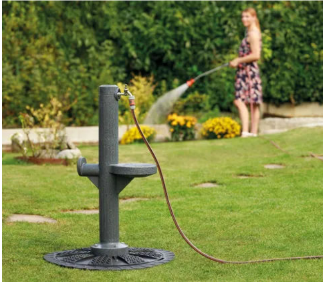
Vielseitige und komfortable Wasserentnahme mit Zapfsäule. Exklusiv bei Rewatec ist die Zapfsäule auf den Tankdeckel aufsetzbar