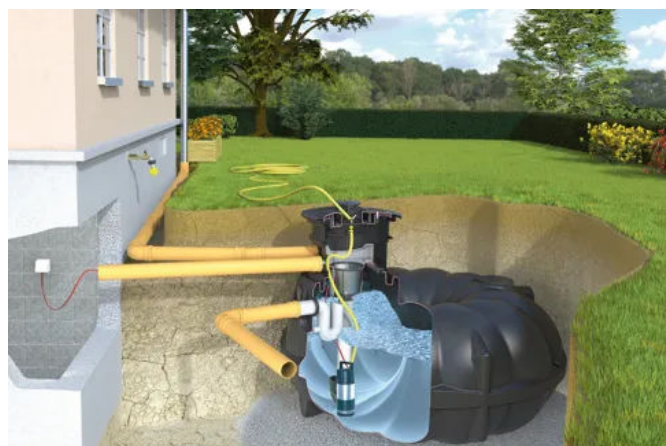
Garten-Komplettanlage Profi – Mit besonders leistungstarker Tauchdruckpumpe, Profi-Filterschacht und Wasserentnahme im Tankdeckel