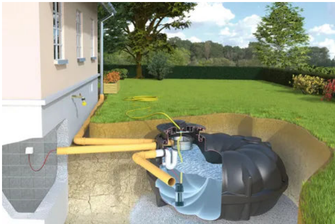
Garten-Komplettanlage Basic – die preiswerte Lösung mit Wasserentnahme im Tankdeckel

Regenwasser ist viel weicher und kalkfreier als Trinkwasser, das mögen Pflanzen besonders gern. Da liegt es nahe, kostenloses Regenwasser zu sammeln und für die Bewässerung an trockenen Tagen zu nutzen.