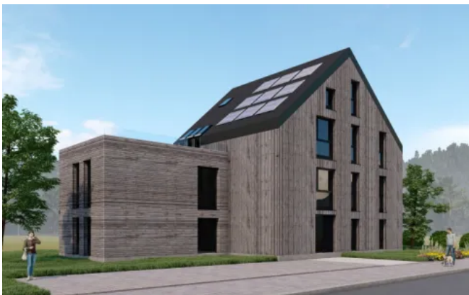
Inara Suites Visualisierung (© Grafik: Ganter Architekten)

In Titisee im Schwarzwald entsteht als Erweiterung des überregional bekannten Seehotels Wiesler ein neues Appartementhaus: die „Inara Suites“. In Kooperation mit dem Sentinel Haus Institut (SHI) richtet sich der Fokus des Bauprojekts auf maximale Nachhaltigkeit und Zirkularität. Ziel ist es, ein Gebäude zu schaffen, in dem so viele Materialien und Bauteile wie möglich am Ende ihrer Nutzungsdauer wieder in biologische oder technische Kreisläufe integriert werden können. Die beiden Saint-Gobain Unternehmen ISOVER und RIGIPS unterstützen das ambitionierte Projekt sowohl mit gesundheitlich empfohlenen und nachhaltigen Produktlösungen als auch mit ihrem einzigartigen „EASY ECO“-Nachhaltigkeitsversprechen.