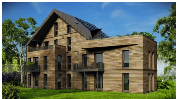
Inara Suites Visualisierung (© Grafik: Ganter Architekten)