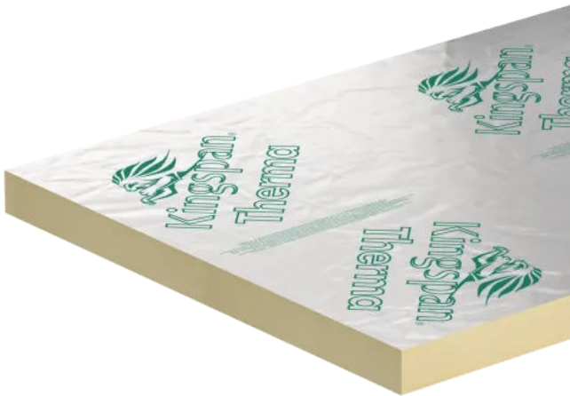
Therma™ TF70 Fußbodenplatte