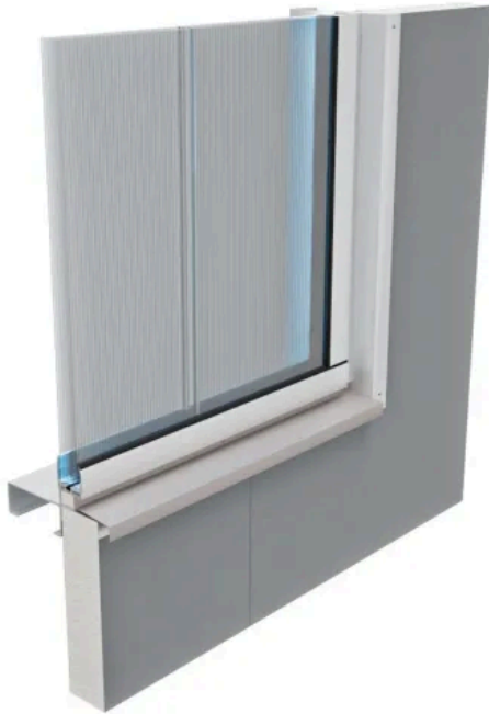
Funktionsfassade Aurora im Schnitt mit PC 60/13 Verglasung

Aus der Serie Tageslichtsysteme für Flachdach und Fassade sowie Zubehörkomponenten von Kingspan Light + Air