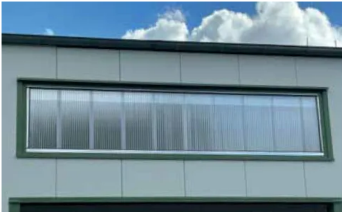
Aurora Set basic plus – eingesetzt in einer Industriehalle