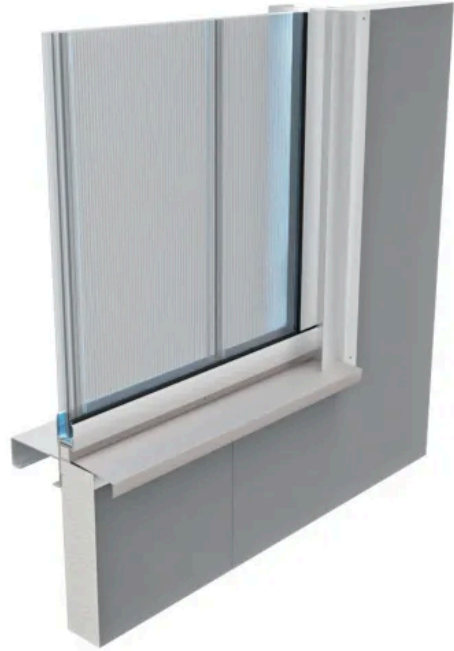
Funktionsfassade Aurora im Schnitt mit PC 40/7 Verglasung