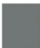
0075 FH Dunkelgrau