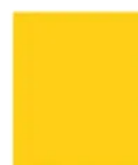
0010 FH Mango