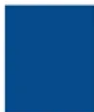
0237 FH Enzianblau