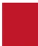
0067 FH Rot