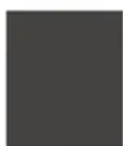
0077 FH Graphitgrau