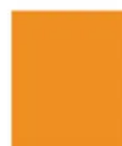
0011 FH Mandarin