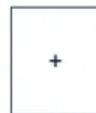
Weitere Farben und Digitaldruck auf Anfrage.