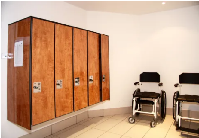
SANA - Barrierefreie Garderobenschränke

Auch für die Ansprüche an die Barrierefreiheit in öffentlichen Einrichtungen, Bädern, Schulen und Betrieben bietet SANA unterschiedliche und individuelle Lösungen. Diese werden in enger Zusammenarbeit mit Planern und Bauherren verwirklicht.