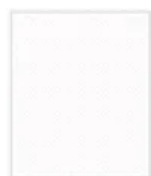
0085 FH Weiss