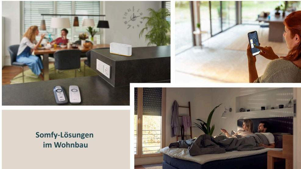
Somfy-Lösungen im Wohnbau

Somfy GmbH Felix-Wankel-Str. 50 72108 Rottenburg Deutschland