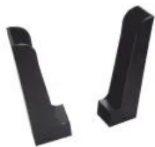
Easy Klick Aufnahmewinkel