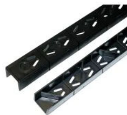
Easy Klick Distanzstück