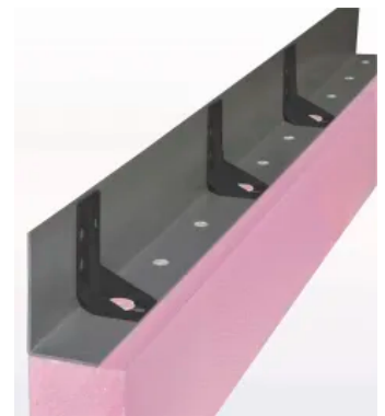
Knickschutz für Absatzprofil