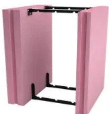
Fundamentalschalung Easy Klick THERMO MIX