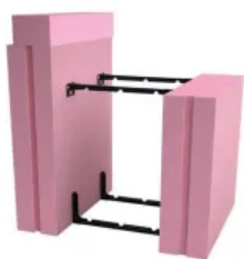
Fundamentalschalung Easy Klick THERMO VARIO