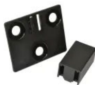
Easy Klick Montageplatte mit Aufnahmeelement