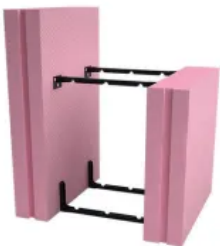
Fundamentalschalung Easy Klick THERMO VARIO