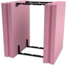
Fundamentalschalung Easy Klick THERMO