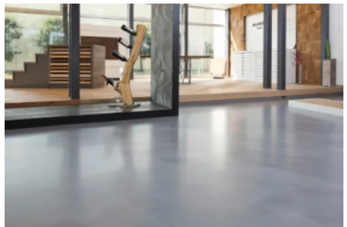
Anwendungsbeispiel Floortec 2K-Sentapur 570