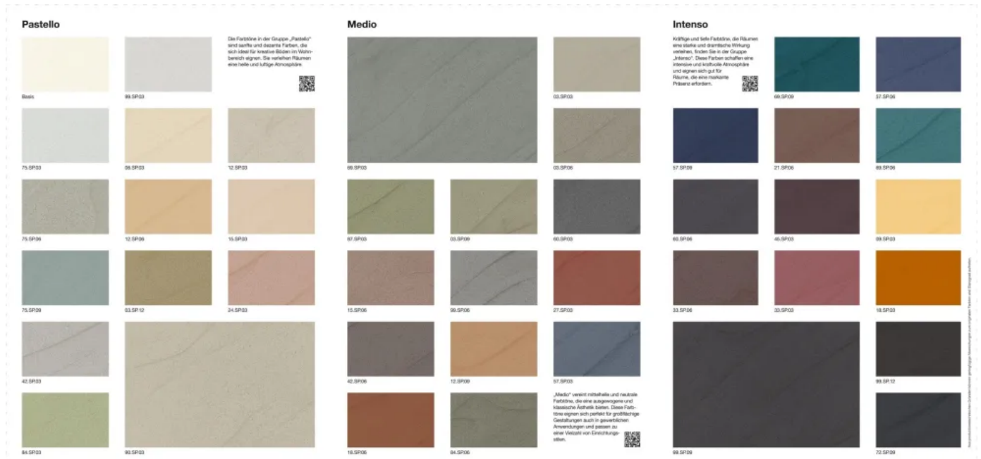
Floortec 2K-Sentopur 570 Farbtonkonzept

Aus der Serie Fugenlose Bodenbeschichtungen von Brillux