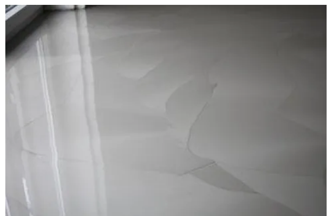
Anwendungsbeispiel Floortec 2K-Sentopur 570