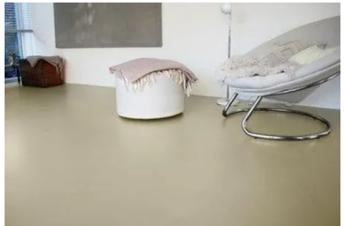
Anwendungsbeispiel Floortec 2K-Sentapur 570