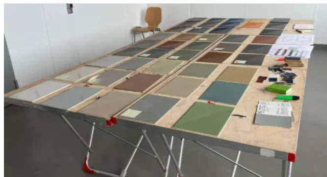
Floortec 2K-Sentopur 570 Farbtonkonzept

42 Farbtöne in 3 Farbgruppen bilden die Basis und können im 6-seitigen Farbton-Leporello inkl. einem Griffmuster ausgewählt werden.