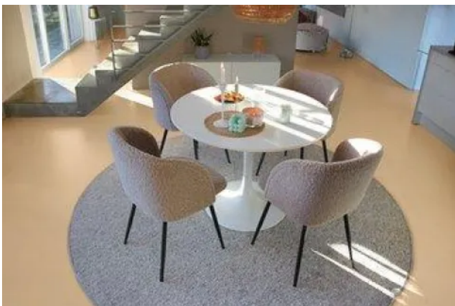
Anwendungsbeispiel Floortec 2K-Sentapur 570