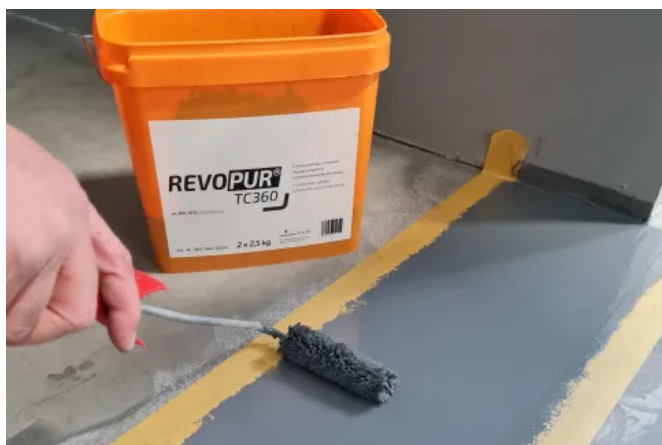
Farbliche Gestaltung mit REVOPUR® TC360