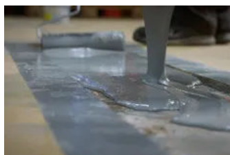
Füllung mit REVOPUR® Fugenliquid

Fugen werden täglich mit schweren Lasten befahren. Dabei müssen sie hohen Druckbelastungen durch schwere Fahrzeuge standhalten. Zu diesen mechanischen Beanspruchungen können Erschütterungen unterschiedlicher Herkunft und temperaturbedingte Längenänderungen hinzukommen. Im Fugensanierung ist eine sorgfältige Ausführung daher besonders wichtig.