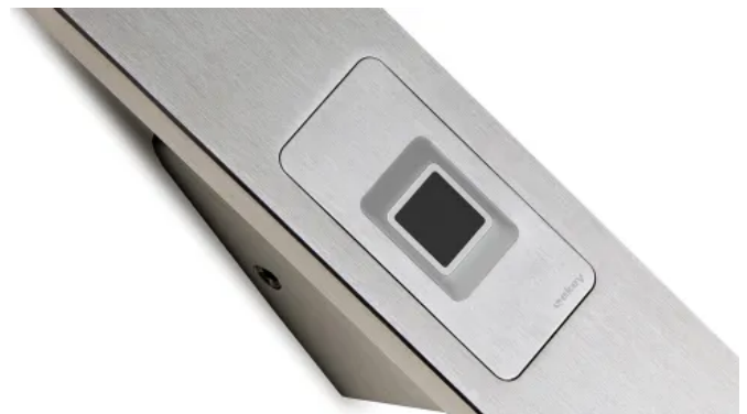
Der ekey dLine Fingerprint lässt sich durch die kleinstmögliche Bauform schön im Türgriff verbauen.

Verbaut wird der ekey dLine Fingerprint direkt ab Werk vom Verarbeiter. Eine Integration ist in den Türgriff wie auch ins Türblatt möglich. Für beide Varianten wird nur eine Bauform benötigt, so verringern sich Bestell- und Lageraufwand. Die Produktgeneration bietet eine kleinstmögliche Bauform und fügt sich harmonisch in jedes Türdesign ein. Der Leuchtring des Fingerprints stellt ein ergänzendes optisches Highlight dar und signalisiert Systemrückmeldungen und Betriebsmodi.