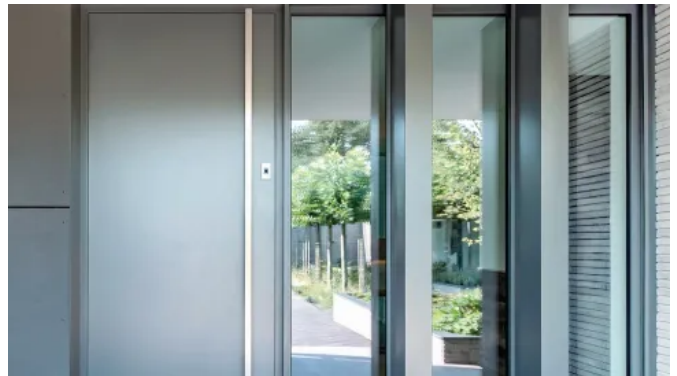
Im Türblatt verbaut, fügt sich der ekey dLine Fingerprint harmonisch ins Türdesign ein.

Ein kompaktes Online-Informationspaket sowie die einfache Bedienung über die ekey bionyx App reduzieren den Schulungsaufwand. Über den Testmodus kann eine vereinfachte Abschlusskontrolle von Motorschloss, Verkabelung und Fingerprint durchgeführt werden. Sollte es dennoch Bedarf geben, kann über die ekey bionyx App Support angefordert werden, der über Fernwartung auf das System zugreifen kann. Aftersales-Aufwand und Vor-Ort-Einsätze lassen sich dadurch deutlich reduzieren.