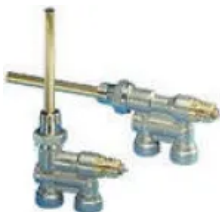
RA 15/6 T und RA 15/6 TB

RA-G mit großen k_v -Werten wird in Einrohranlagen (reitende Heizkörperanbindung) und in Schwerkraftanlagen eingesetzt.