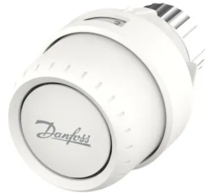
Danfoss Aveo™, Behördenmodell

Für den Einsatz in Gewerbe und öffentlichen Gebäuden steht mit dem gasgefüllten Thermostatkopf Aveo™ ein diebstahl- und manipulationssicheres Behördenmodell zur Verfügung. Zwei Begrenzungsstifte und ein Spezialwerkzeug verhindern hierbei eine unerwünschte Veränderung der Temperatureinstellungen. Zudem kann die Temperatureinstellung durch eine optional erhältliche Skalenabdeckung verborgen werden. Der Thermostatkopf eignet sich für Anbau- und Einbauventile mit Danfoss RA-Anschluss und Imbus-Befestigung und kann durch einen Sicherungsstift zusätzlich verriegelt werden. Aveo™ deckt den Temperaturbereich von 7 bis 28°C ab und ist in Varianten mit Fernfühler (0 bis 2 m) oder eingebautem Fühler erhältlich. Perspektivisch soll Aveo™ die Behördenmodelle der gasgefüllten RA-Thermostatkopfsreihe ersetzen.