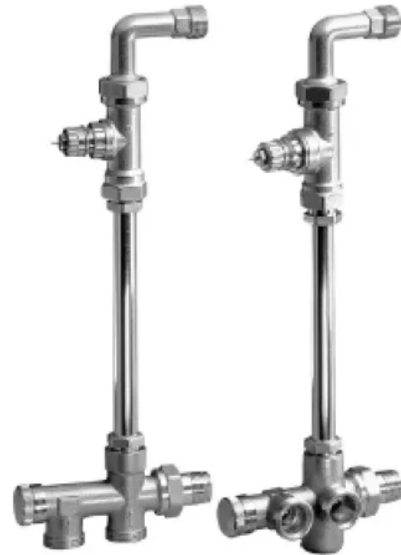
RA-K mit Bodenanschluss