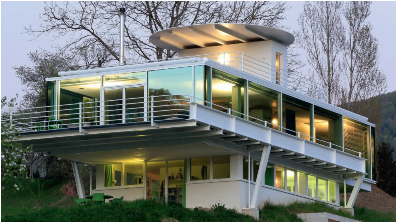
Vorhangfassade forster thermfix vario Hi: wärmegedämmte Pfosten/Riegel-Fassade, Türen