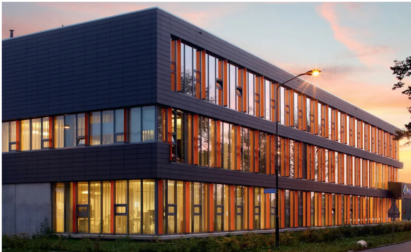
Wärmegeämmte Pfosten-Riegel Fassade, Brandschutztüren und Verglasungen

Aus der Serie Forster Profilsysteme für Fenster, Türen und Fassaden aus Stahl und Edelstahl von Forster Profilsysteme