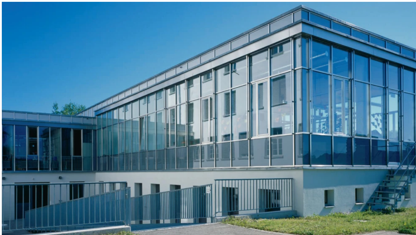
forster thermfix vario Systemprofile für wärmegeämmte Vorhangfassaden

Aus der Serie Forster Profilsysteme für Fenster, Türen und Fassaden aus Stahl und Edelstahl von Forster Profilsysteme