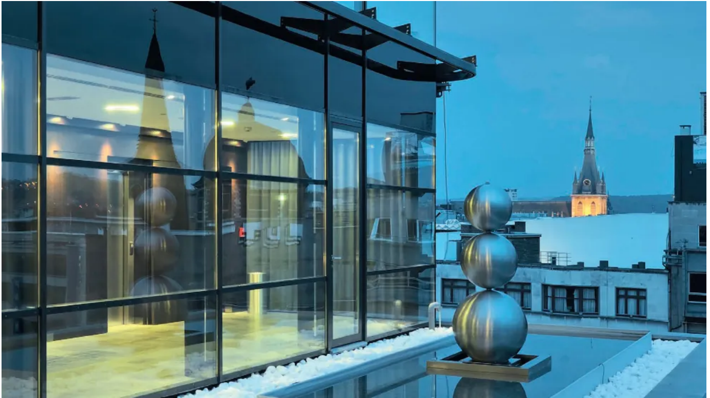
Wärmegeämmte forster Vorhangfassade Thermix vario

Aus der Serie Forster Profilsysteme für Fenster, Türen und Fassaden aus Stahl und Edelstahl von Forster Profilsysteme