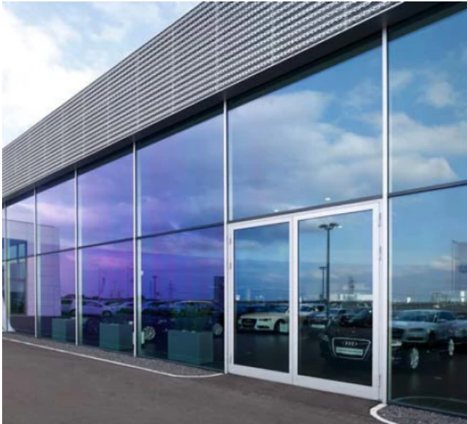
Forster thermfix light Fassaden und Festverglasungen

Aus der Serie Forster Profilsysteme für Fenster, Türen und Fassaden aus Stahl und Edelstahl von Forster Profilsysteme