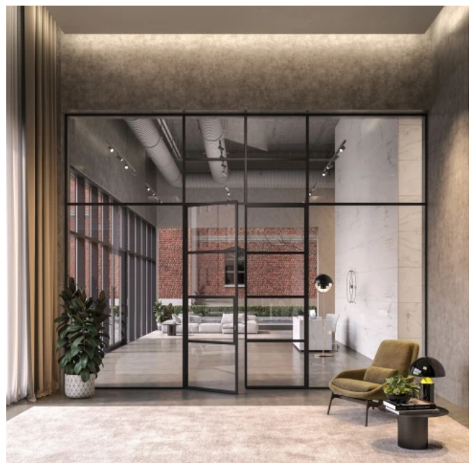
Profilsystem forster presto XS

Mehr Informationen zum Profilsystem forster presto XS