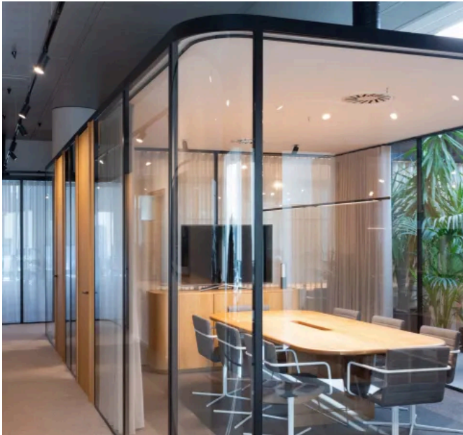
Profilsystem forster presto XS, Bild: NOEMA studio - Architecture & Design

Aus der Serie Forster Profilsysteme für Fenster, Türen und Fassaden aus Stahl und Edelstahl von Forster Profilsysteme