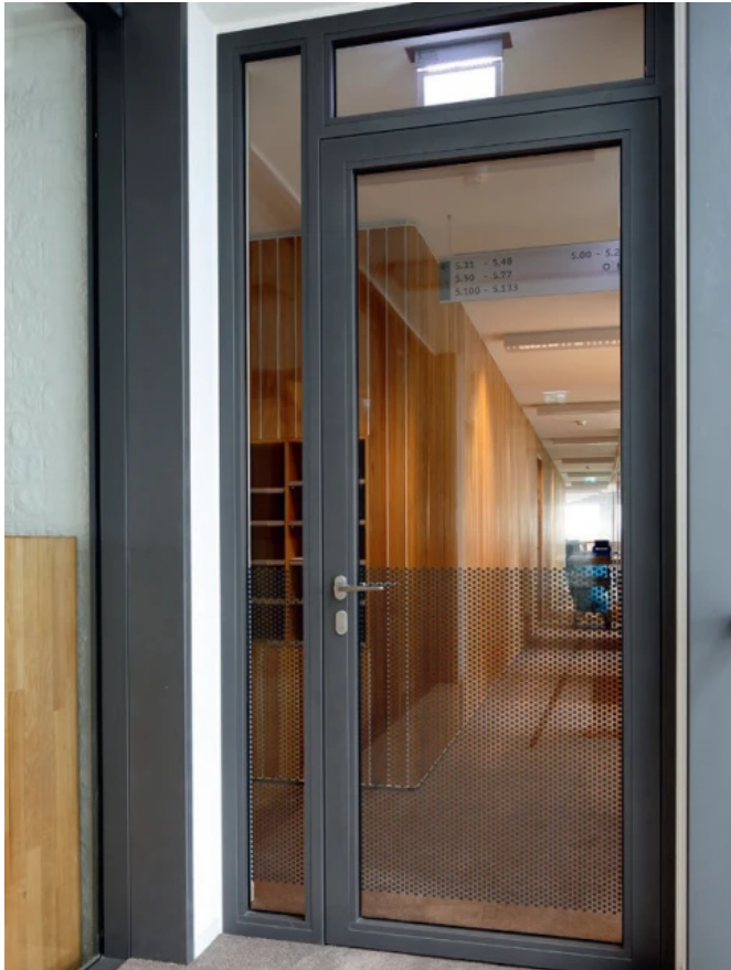
Brandschutztüren forster presto

Aus der Serie Forster Profilsysteme für Fenster, Türen und Fassaden aus Stahl und Edelstahl von Forster Profilsysteme