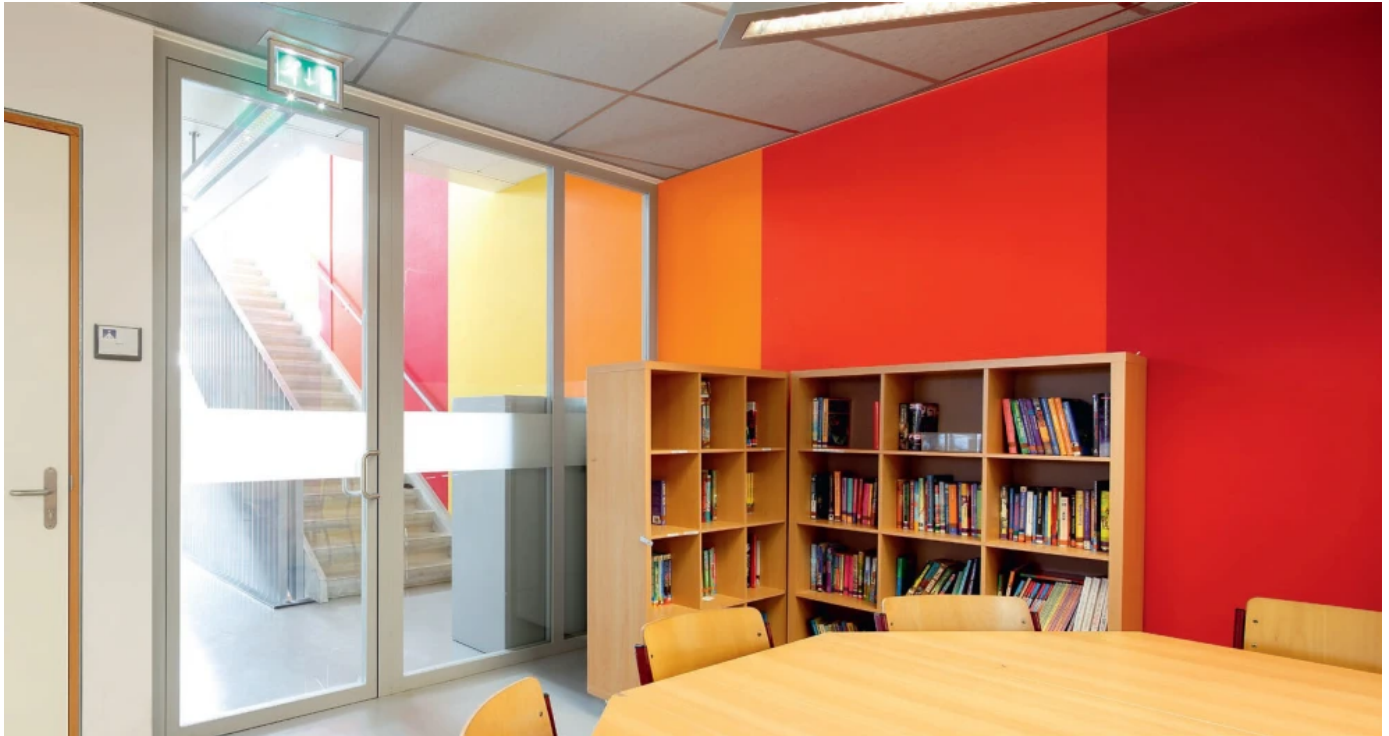
Profilsystem forster presto

Aus der Serie Forster Profilsysteme für Fenster, Türen und Fassaden aus Stahl und Edelstahl von Forster Profilsysteme