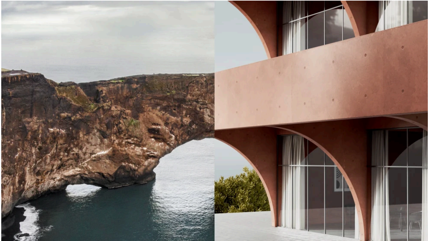
Profilsystem forster presto XS

Aus der Serie Forster Profilsysteme für Fenster, Türen und Fassaden aus Stahl und Edelstahl von Forster Profilsysteme