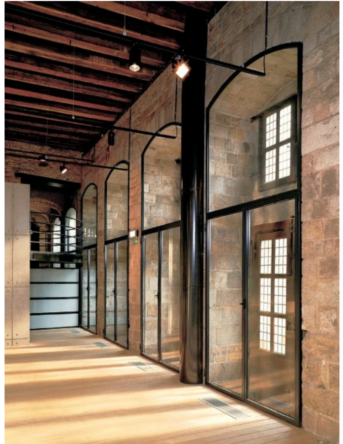
Türen und Verglasungen forster presto