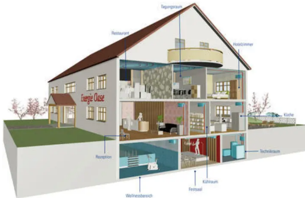
Heizen und Kühlen mit innovativer Technik

Aus der Serie Flüssiggas als Antriebs-, Heiz- und Prozessenergie von Tyczka Energy