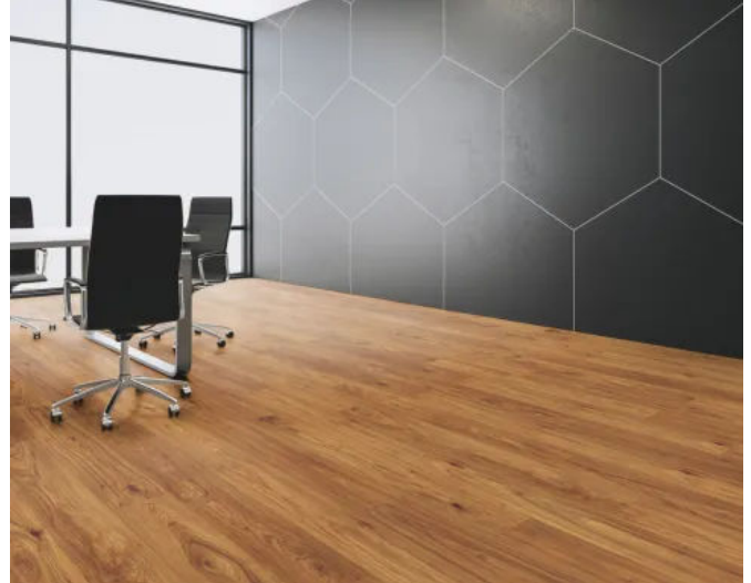
FLOORrganic XPT K2911 Pharell-Hickory-CANYON