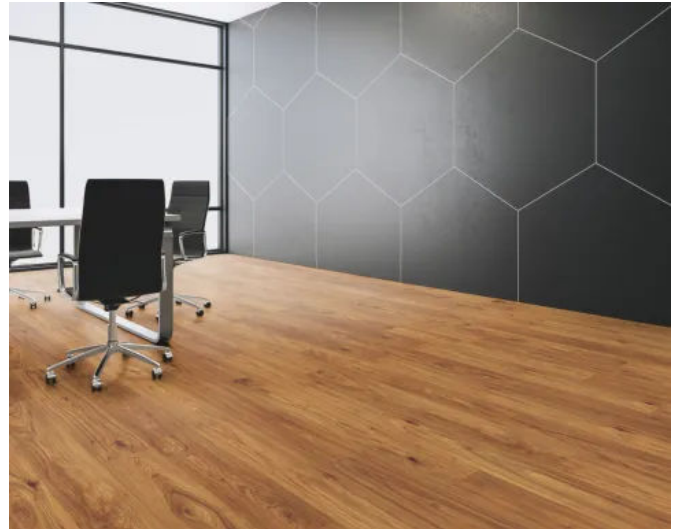
FLOORrganic XPT K2911 Pharell-Hickory-CANYON