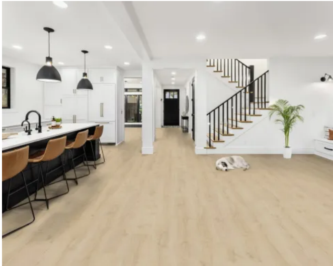
FLOORrganic XPT K2908 Oak Sarocco-NOTO

Aus der Serie Fußböden - Kaindl Flooring von Kaindl