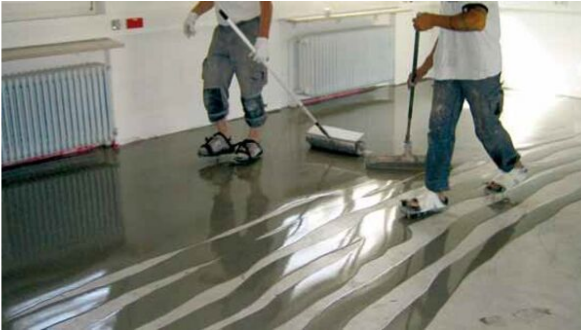
Fließspachtelmasse, Premiumspachtelmasse, fasergestärkter Fließspachtel und Calciumsulfatgebundener Fließspachtel

Aus der Serie Bodensysteme von Saint-Gobain Weber