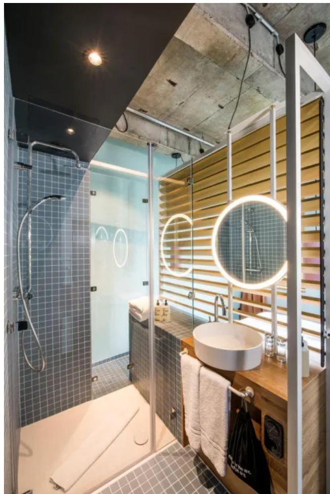
Verschiedene Mosaikfliesen mit durchgehendem Muster finden sich in den Bädern an Wand und Boden.