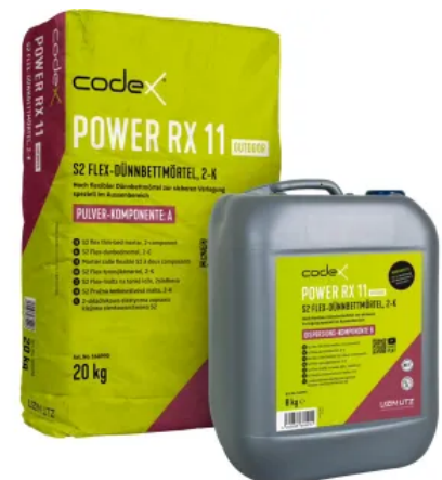
codex Power RX 11 Outdoor