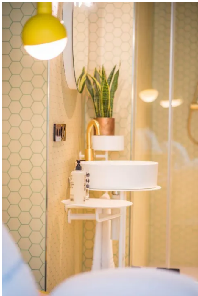
Moderne Sechseck Fliesen wurden im Retro-Look mithilfe des 3-K Design-Epoxi-Mörtels codex X-Fusion verlegt.