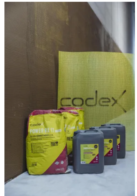
codex Power RX 11 Outdoor