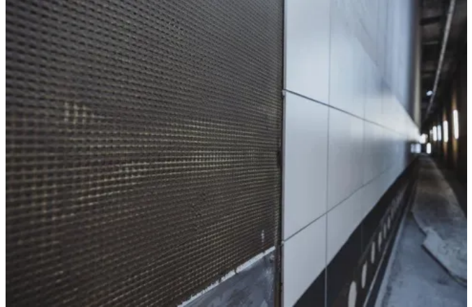
Bei der Sanierung wurden die Wände in den Ein- und Ausfahrtbereichen der ersten Röhre mit neuen Keramikfliesen verkleidet.