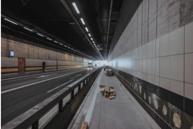
Die Tunnelröhren sind aufgrund der erhöhten Feuchtigkeit und den Temperaturschwankungen starken Belastungen ausgesetzt

Aus der Serie Fliesen und Naturstein verlegen und verfugen von Uzin Utz