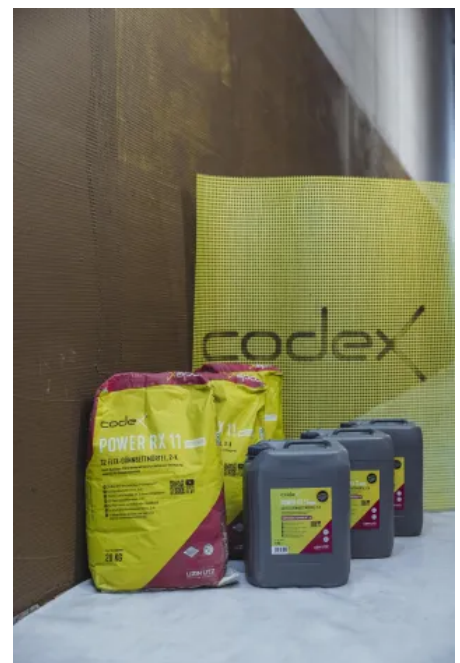
codex Power RX 11 Outdoor