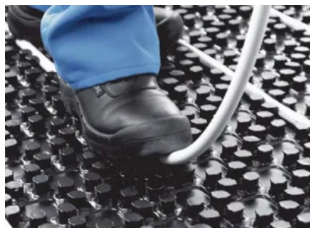
Fest definierte Verlegeabstände können eingehalten werden.