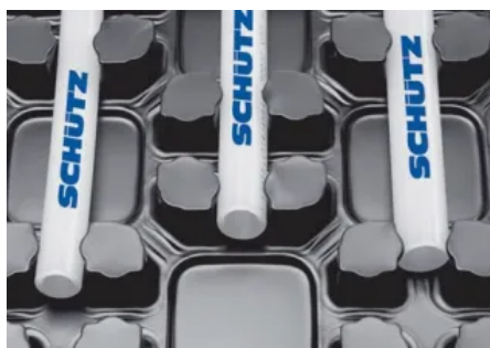
Die Heizrohre sind sicher zwischen den Haltenocken fixiert

Die Systemnockenplatte und das Heizrohr kann von einer einzelnen Person verlegt werden (Einmannverlegung). Der Verlegeabstand ist durch die Nocken exakt definiert, so werden die geplanten Verlegeabstände verlässlich eingehalten.