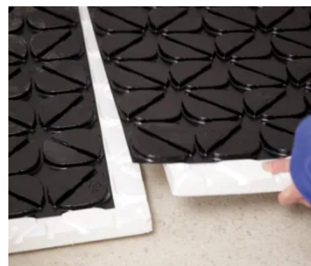
Durch den Folienüberstand lassen sich die Systemplatten sicher und estrichdicht verbinden.