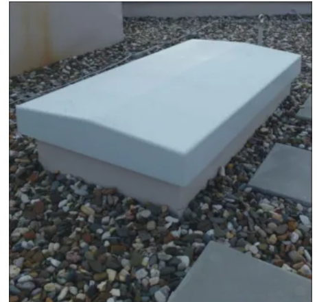
Integrierte Hinterlüftung des Deckels

Die getrennten Bestandteile werden nacheinander eingebaut. Durch das geringe Gewicht von Futterkasten, FlachdachAusstieg und Treppe ist der Einbau ohne Kran möglich.