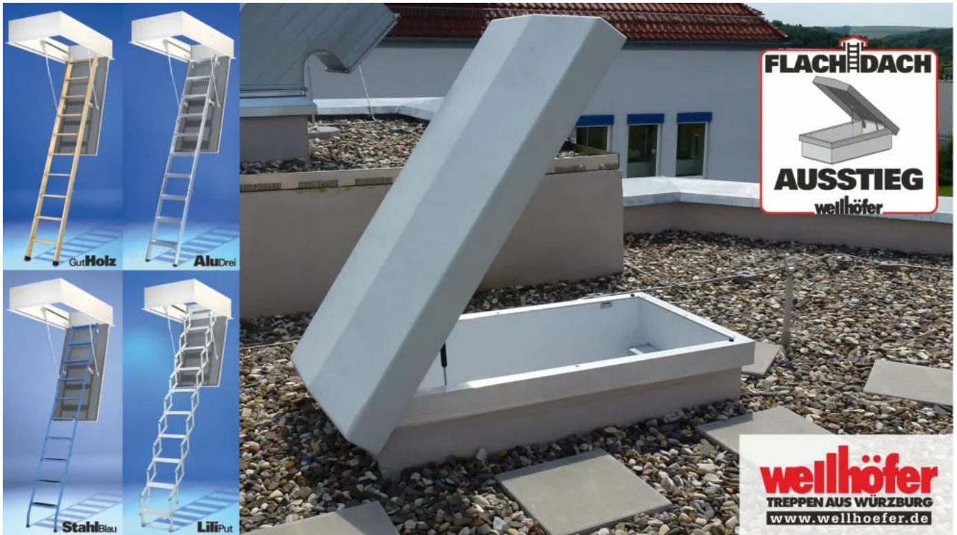
Die Flachdachausstiege sind mit allen Bodentreppen-Typen und Ausstattungen kombinierbar.