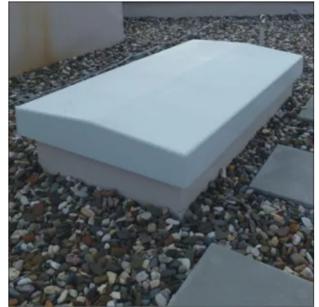
Integrierte Hinterlüftung des Deckels

Die getrennten Bestandteile werden nacheinander eingebaut. Durch das geringe Gewicht von Futterkasten, FlachdachAusstieg und Treppe ist der Einbau ohne Kran möglich.