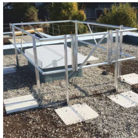
Geprüftes Sicherheitsgeländer von Wellhöfer