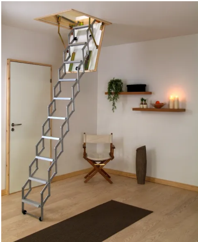
DOLLE alu-fix mit Lukenkasten