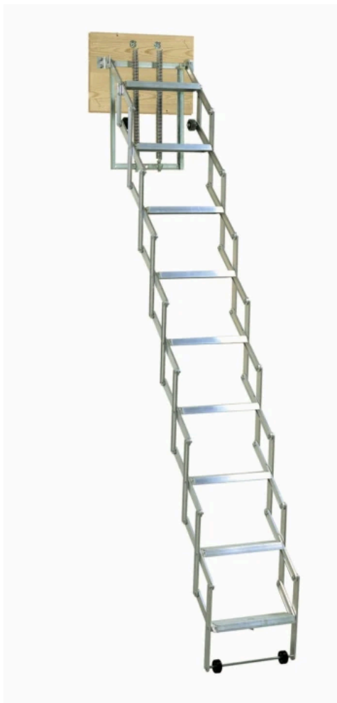
DOLLE alu-fix mit Stirnbrett

Aus der Serie Flachdachausstiege und Bodentreppen von DOLLE