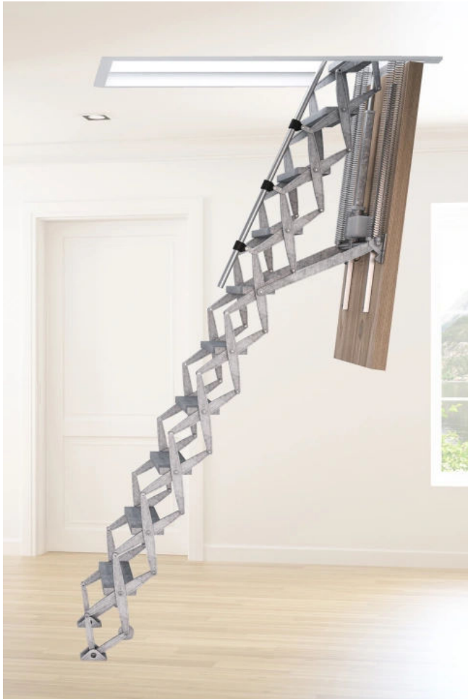
DOLLE alu-top elektrisch

Aus der Serie Flachdachausstiege und Bodentreppen von DOLLE