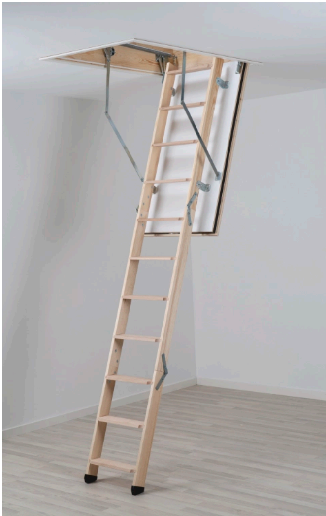
DOLLE F 30