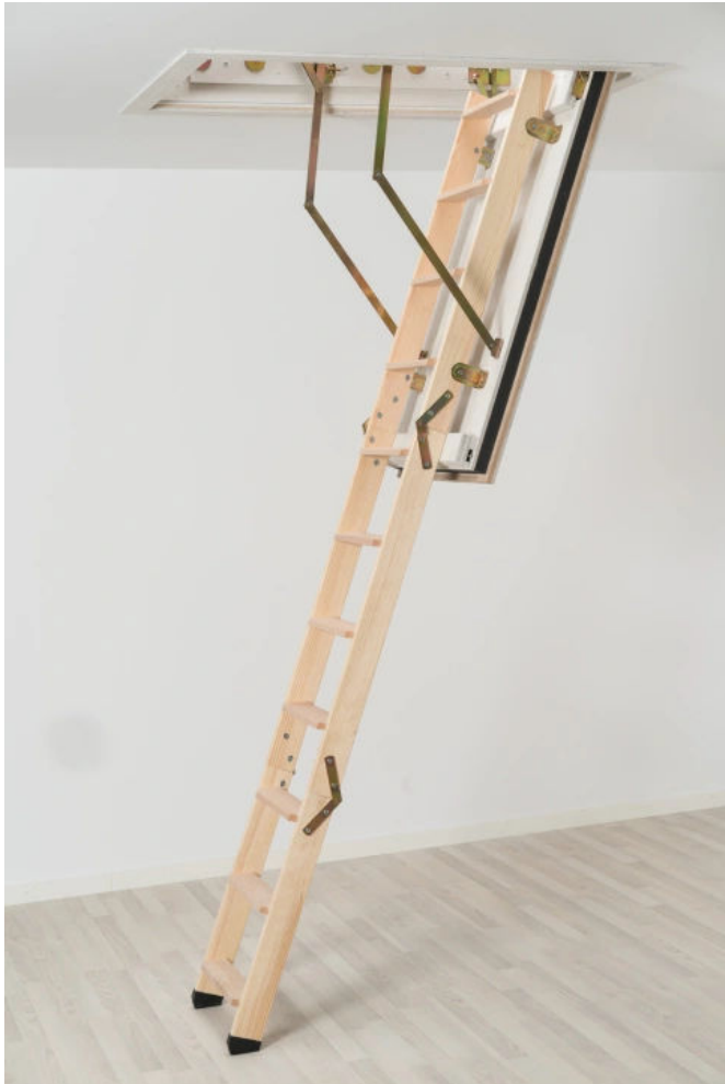
DOLLE F 90

Aus der Serie Flachdachausstiege und Bodentreppen von DOLLE