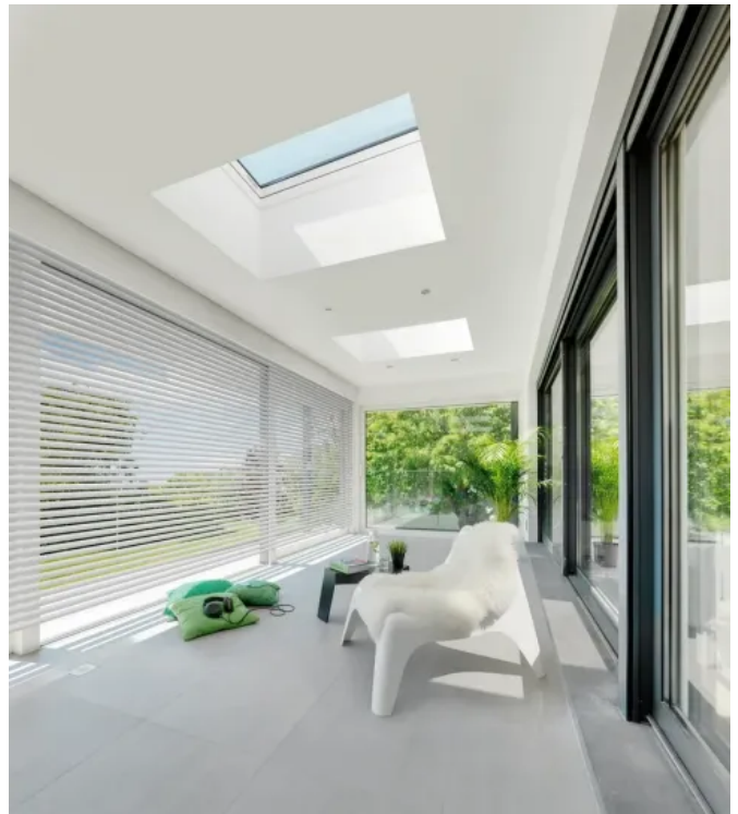
Die Flachdach-Fenster D_F sind mit Drei- oder Vierfachverglasung ausgestattet.

Flachdach-Fenster D_F im flachen, fast randlosen Design kommen ohne Lichtkuppel aus. Die obere Flachglasscheibe der Verglasung ragt über die darunterliegenden heraus und ist somit nahezu rahmenlos ausgeführt. So entsteht ein energetisch hochwertiges Fensterprodukt im schlichten, zeitlosen Design.