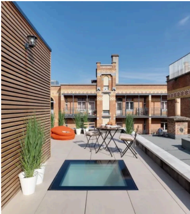
Das Flachdach-Fenster DXW wurde mit „ICONIC AWARDS 2018: Innovative Architecture - Best of Best“ ausgezeichnet.