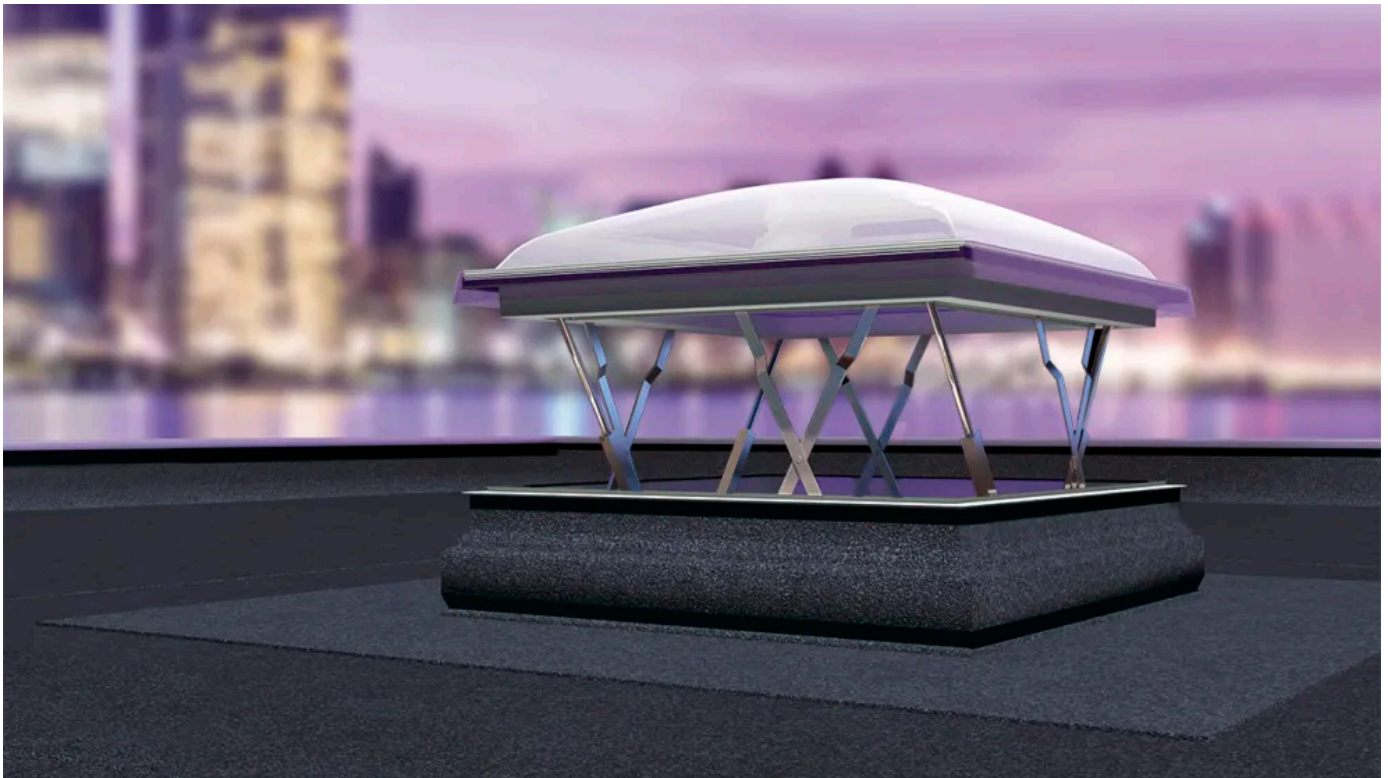
Das RWA-Flachdach-Fenster DSC-C2 P2 wird im Brandfall automatisiert geöffnet

Die Rauchabzugsfenster DSC und DSF für Flachdächer ermöglichen den Rauch- und Wärmeabzug im Brandfall und unterstützen damit eine schnelle Evakuierung der Bewohner. Sie können insbesondere in Treppenhäuser auch zum täglichen Lüften und zur Raumbelichtung genutzt werden. Rauchabzugsfenster verbinden die Funktionen eines Fensters mit denen einer Rauchabzugsklappe.