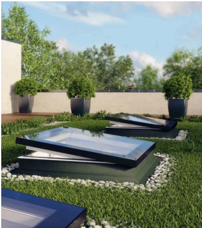
Flachdach-Fenster D_F im flachen, fast randlosen Design kommen ohne Lichtkuppel aus.