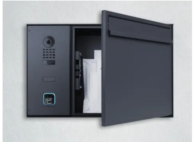
Der smarte ekey Briefkasten

Ob als Aufputz- oder Unterputzvariante, das System integriert sich flexibel in bestehende Installationen und ist zukunftssicher.