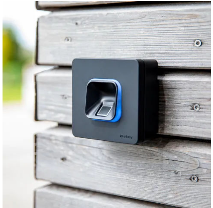
Den ekey xLine Fingerprint gibt es sowohl als Unter- als auch (wie hier abgebildet) als Aufputzvariante.

Die ekey bionyx App führt intuitiv durch den gesamten Prozess.