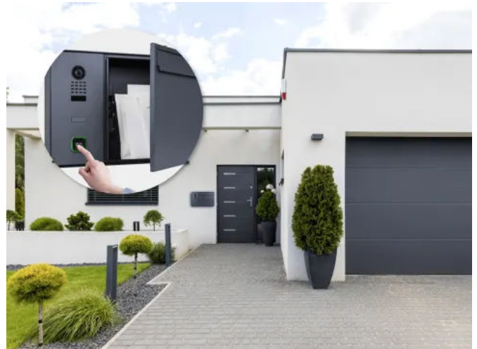
Der smarte ekey Briefkasten

Ausgestattet mit einer Ultraweitwinkel-HDTV-Kamera und einer 180°-Linse liefert das System gestochen scharfe Bilder. Selbst bei Dunkelheit sorgen zwölf Infrarot-LEDs für hervorragende Sicht, während fortschrittliche Sprachübertragung eine klare Kommunikation gewährleistet.