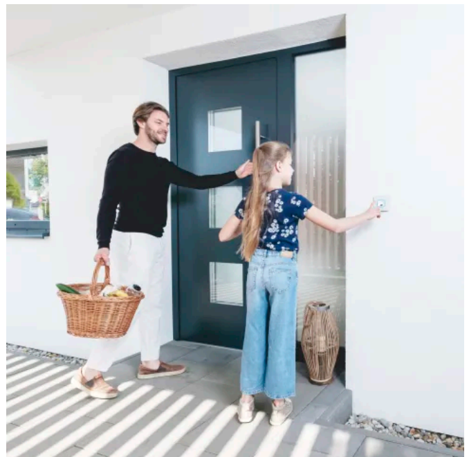
Der Fingerprint ist kinderleicht zu bedienen – bereits Kinder ab sechs Jahren können ihn einfach benutzen.

Wie auch bei der ekey dLine, kommt bei den neuen Fingerprint-Generationen für Unter- und Aufputz sowie Sprechanlagen und Hohlräume ein Flächensensor zum Einsatz. Damit entsprechen sie dem aktuellen Stand der Technik, den User bereits aus ihrem Alltag, wie etwa vom Smartphone, kennen. Die Bedienung des Fingerprints erfolgt durch die benutzerfreundliche Touchbedienung intuitiv. Durch die laufende Verwendung lernt der Fingerprint mit, somit stellen kleine Verletzungen am Finger oder das Wachstum von Kinderfingern kein Problem dar. Der patentierte ekey-Algorithmus wurde für die zukunftsichere Sensortechnologie optimiert.