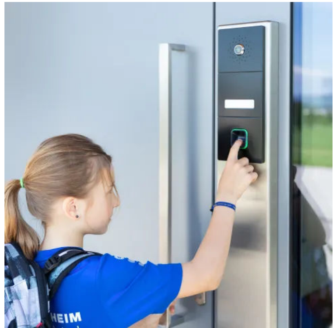
Eltern können sich auf Wunsch benachrichtigen lassen, wenn der Nachwuchs sicher nach Hause gekommen ist.

Die klassischen Vorteile des Fingerprints – wie schlüsselloses Öffnen, höchste Sicherheit oder mehr Komfort – werden bei ekey xLine und ekey sLine ergänzt von zusätzlichen Funktionen. Neben Basisfunktionen wie z. B. einem Zutrittsprotokoll, runden smarte Features den Funktionsumfang ab. So lassen sich etwa Zutrittspunkte mittels Fernöffnung auch unterwegs jederzeit bei Bedarf öffnen oder die Anbindung an den Sprachassistenten Amazon Alexa bringt zusätzlichen Komfort. Eine smarte Funktion, die besonders für Eltern praktisch ist: die Push-Nachricht. Damit kann man sich, wenn das Kind sicher von der Schule nach Hause gekommen ist und die Tür mit dem Fingerprint öffnet, auf Wunsch direkt informieren lassen. Auch Benutzer können von standardmäßig 20 auf bis zu 100 erweitert werden. Somit passen sich die Systeme genau an individuelle Bedürfnisse an.