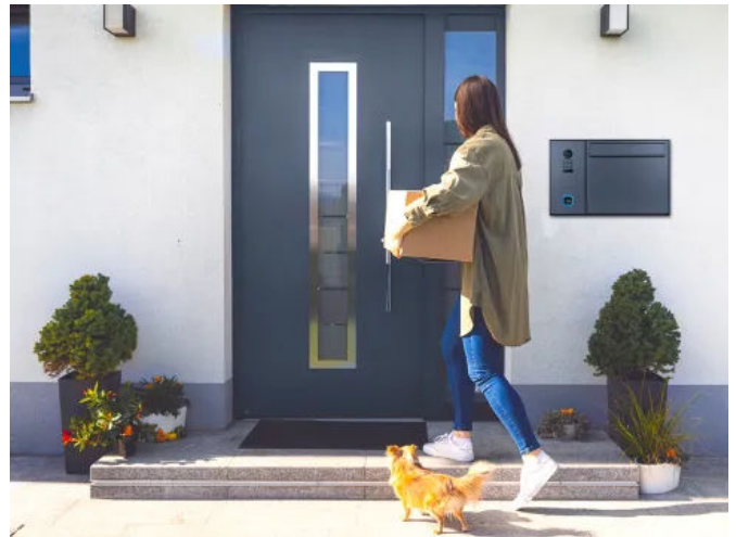
Der smarte ekey Briefkasten

Der ekey Briefkasten bietet eine smarte Komplettlösung, die HELLO Briefkasten, ekey Fingerprint und DoorBird Sprechanlage perfekt vereint. Der smarte ekey Briefkasten kombiniert klassische Funktionen mit moderner Fingerprint-Technologie und einer integrierten Videosprechanlage. Dieses innovative System ermöglicht das Öffnen der Haustür und des Briefkastens per Fingerabdruck – ein Finger öffnet die Tür, ein anderer den Briefkasten – ganz ohne Schlüssel, Code oder Karte. Neben höchsten Sicherheitsstandards bietet die Komplettlösung auch die Smart-Home-Kompatibilität.