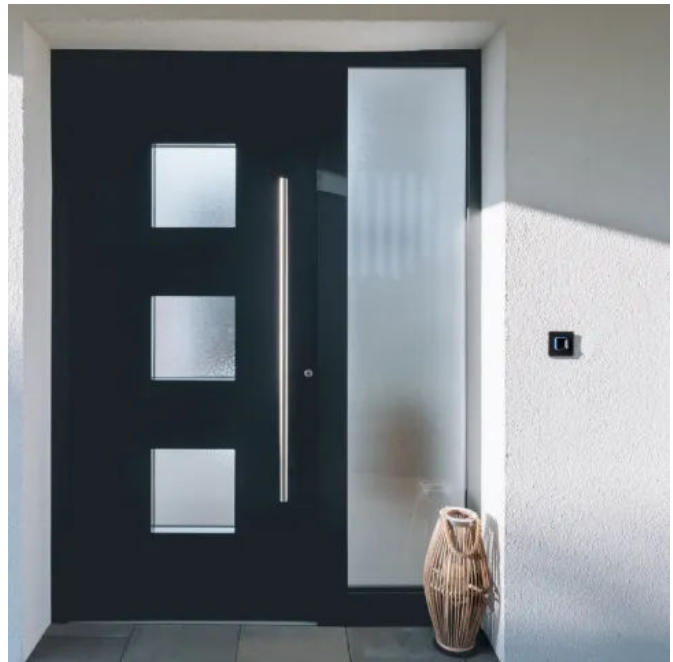
Mit dem ekey xLine Fingerprint startet das Smart-Home bereits beim Nachhausekommen.