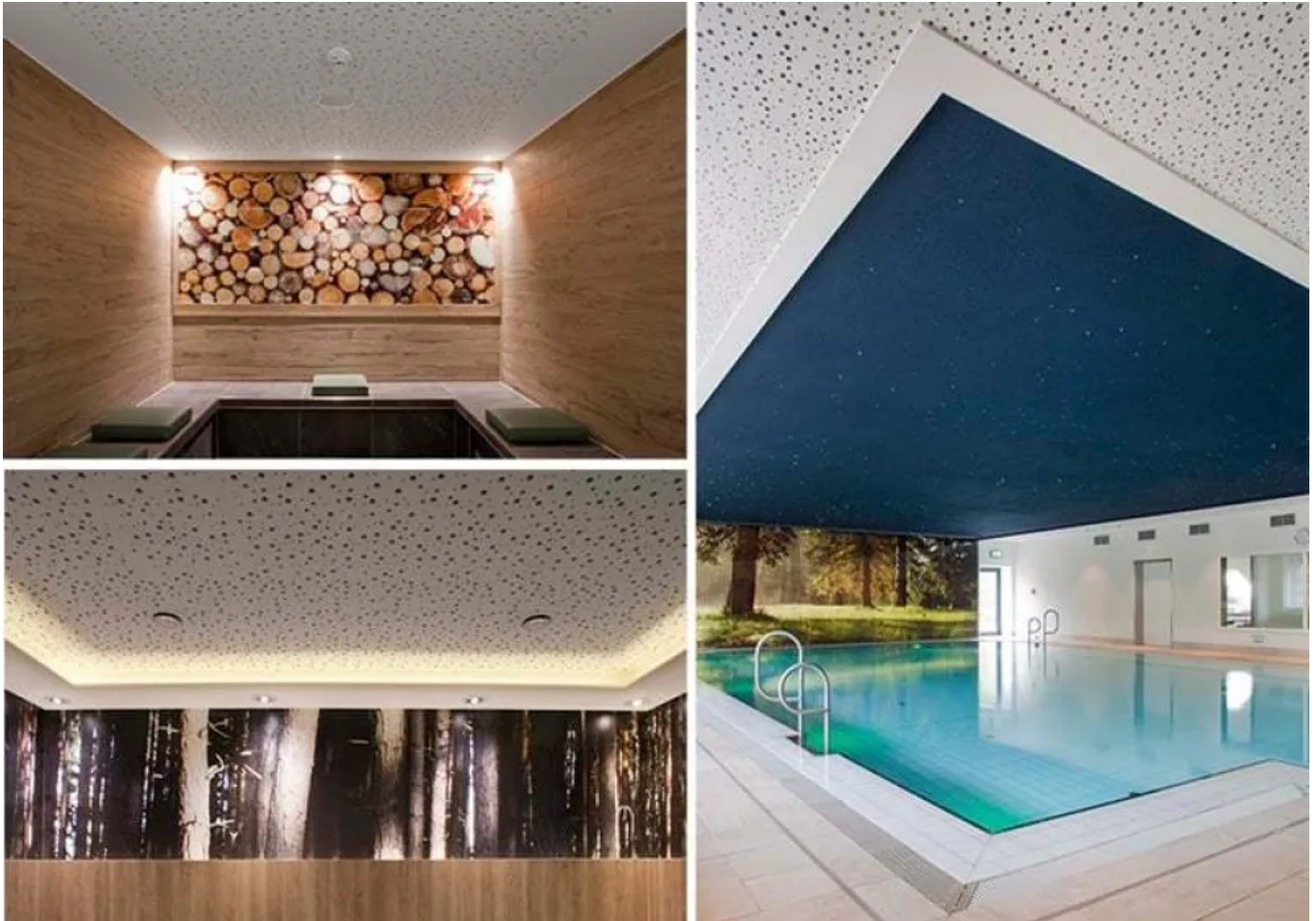
Berg- und Jagdhotel Gabelbach

Herzstück des Spa-Bereiches ist das knapp 100 Quadratmeter große Schwimmbecken, dessen außergewöhnliche Deckengestaltung Aufsehen erregt: Nach dem Wunsch der Besitzer und einer Idee des Architekturbüros Hornschuh und Besinger funkelt über dem Becken das Abbild eines nächtlichen Sternenhimmels.