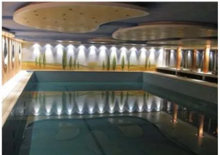
Kurhotel Hochsauerland 2010

Es gibt Formteile für vielfältige Gestaltungsmöglichkeiten – und Spezialplatten für extrem nasse sowie feuchte Bereiche. Im Hallenbad des Hotels Hochsauerland 2010 findet sich die vorteilhafte Kombination aus beidem: Die „Deckeninseln“ bestehen aus Formteilen, die nicht aus Gipskarton, sondern aus glasvliesummantelten LaHydro Spezialplatten von Siniat bestehen.