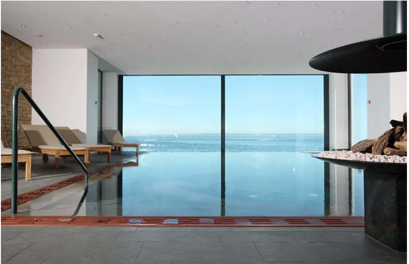
Hotel & Spa Bad Horn

Aus der Serie Trockenbau-Systeme für Wände und Decken von Etex Building Performance Geschäftsbereich Siniat