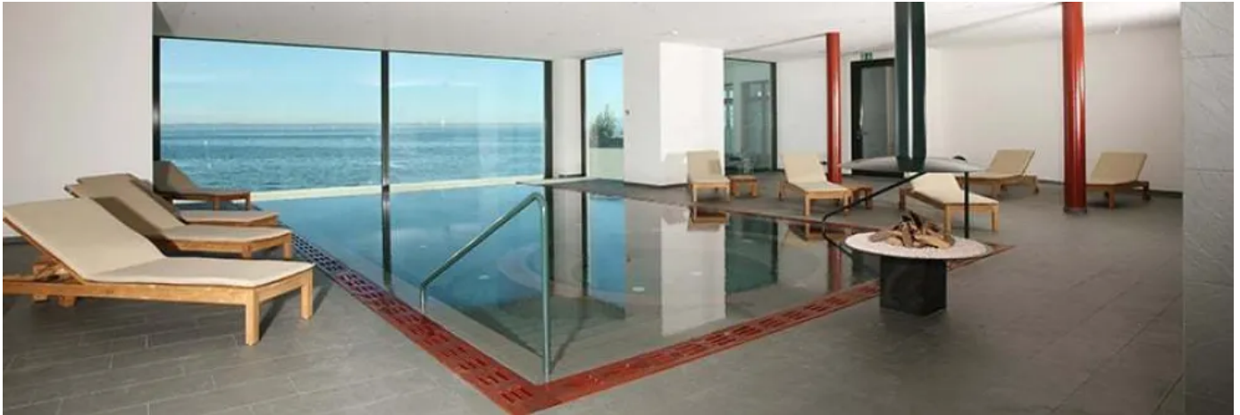
Hotel Spa Bad Horn

Bepunktungen: Spezialplatten mit spezieller Ummantelung