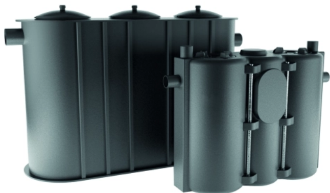
Fettabscheider Sanigrease NS zur Freiaufstellung

Varianten: Freiaufstellung und Erdeinbau