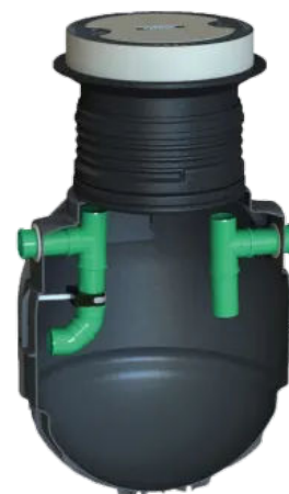
Fettabscheider Sanigrease SUF zum Erdeinbau