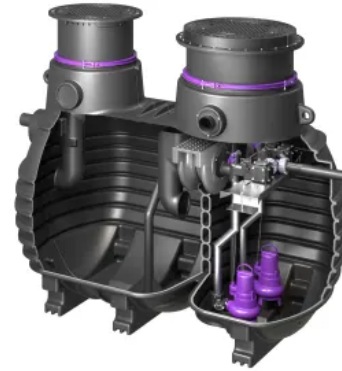
Fettabscheider EasyClean ground Multi Direct