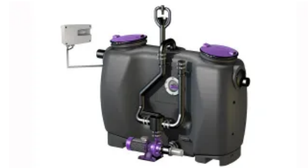
Fettabscheider EasyClean free Mix & Pump mit manueller Entsorgungs-/Spüleinrichtung und Schredder-Mix-System

Die Reinigung und Spülung erfolgt vorzugsweise mit warmen Wasser über die Wartungsöffnungen.