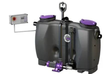
Fettabscheider EasyClean free Auto Mix