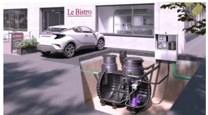
Fettabscheider EasyClean ground Mult Direct