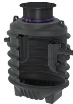
Fettabscheider EasyClean ground Oval