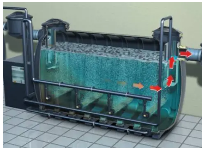
Mikroorganismen reinigen das Abwasser und sauberes Wasser fließt ab.

Die Dimensionierung von BIFENA®-Anlagen erfolgt auf Basis einer Abwasseranalyse durch das technische Fachpersonal.