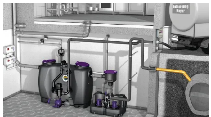
Fettabscheider EasyClean free Auto Mix & Pump

Bei der Entwicklung der KESSEL Fettabscheider EasyClean standen Einbaufreundlichkeit, Reinigungsleistung und Energieeffizienz im Vordergrund. Die geschwungene Form des Behälters erlaubt die Integration der kompletten Technik - zum Beispiel der Füllereinrichtung - auf der Grundfläche des Abscheiders. Er kann platzsparend direkt an der Wand aufgestellt werden.