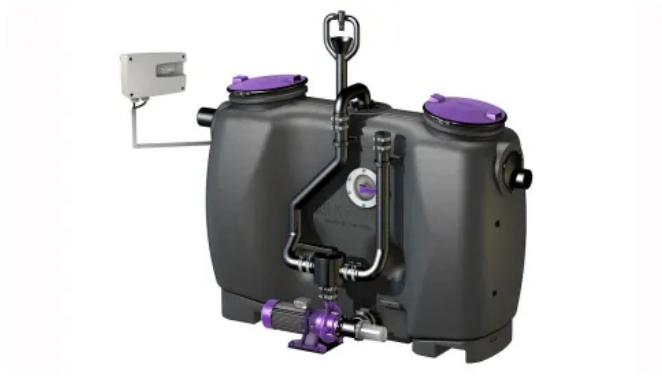
KESSEL Fettabscheider EasyClean free NS 2-20 (Entsorgungsvariante Mix & Pump)

Aus der Serie Abscheidetechnik für Industrie und Gewerbe von KESSEL Entwässerungstechnik