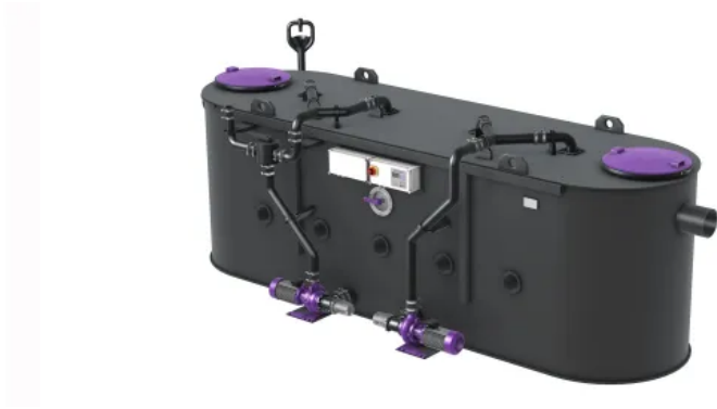
KESSEL Fettabscheider EasyClean free NS 25-50 (Entsorgungsvariante Mix & Pump)

EasyClean-Abscheider lassen sich auch im eingebauten Zustand bis zur vollautomatischen Anlage nachrüsten und damit geänderten Anforderungen anpassen.