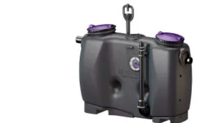
Fettabscheider EasyClean free Direct mit Direktentsorgung