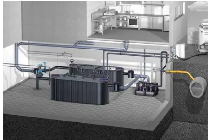
Fettabscheider EasyClean free Auto Mix & Pump als Doppelbehälteranlage mit Verteilerbauwerk und Probenahmereinrichtung und Hebeanlage.

Fettabscheider EasyClean free NS 25 - NS 50 bieten erweiterte Einsatzmöglichkeiten in gewerblichen und industriellen Betrieben. Alle Arten der Entsorgung sind hier verfügbar, von der Grundversion Standard mit manueller Entsorgung bis hin zur Version Auto Mix & Pump mit automatischer Entsorgungs- und Spüleinrichtung.