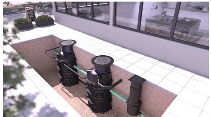
Fettabscheider EasyClean ground Auto Mix & Pump