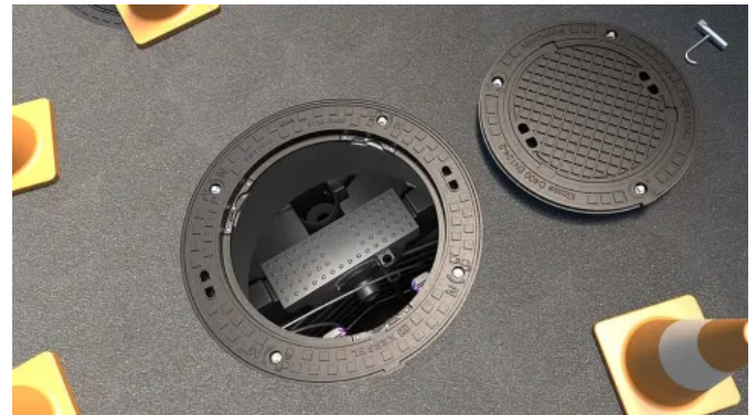
Einfache Kontroll- und Wartungsarbeiten sind durch den kleinen Deckelzugang schnell und sicher durchführbar. Die Zugangsöffnung kann bei Bedarf auf 800 mm erweitert werden.