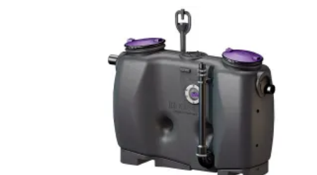
Fettabscheider EasyClean free Standard Grundversion