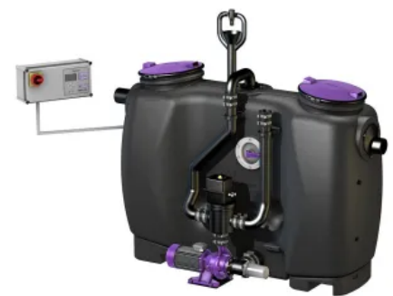
Fettabscheider EasyClean free Auto Mix & Pump mit automatischer Entsorgungs-/Spüleinrichtung und Schredder-Mix-System

Die Reinigung des Abscheiders erfolgt parallel zum Umwälzen und Zerkleinern des Behälterinhaltes mit kaltem Frischwasser. Dadurch wird weder ein Vorlagebehälter noch ein Warmwasseranschluss benötigt. Bei der Entsorgung und Reinigung entsteht keine Geruchsemission.