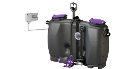
Fettabscheider EasyClean free Mix mit Direktentsorgung und Schredder-Mix-System