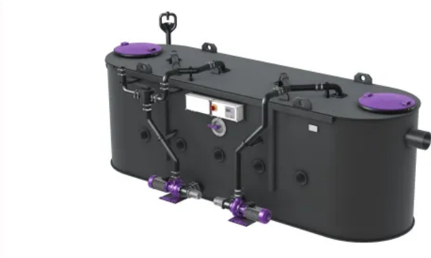
KESSEL Fettabscheider EasyClean free NS 25-50 (Entsorgungsvariante Mix & Pump)

EasyClean-Abscheider lassen sich auch im eingebauten Zustand bis zur vollautomatischen Anlage nachrüsten und damit geänderten Anforderungen anpassen.