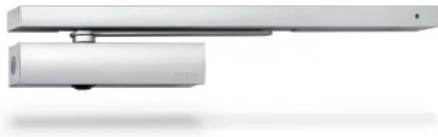
TS 5000 RFS 3-6 – Gleitschienentürschließer für einflügelige Türen bis 1400 mm Flügelbreite mit elektrischer Freilauffunktion und Rauchschalterzentrale

Aus der Serie Drehtüren: Antriebe, Türschließer, Feststellanlagen und Türkomfort von GEZE