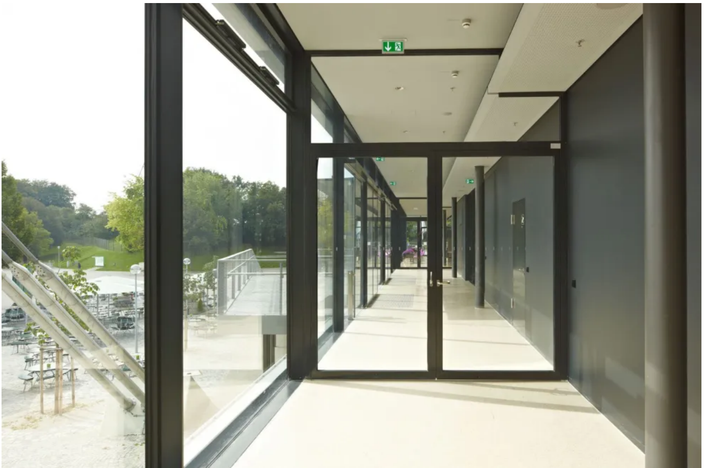
TS 5000 R-ISM – Gleitschienentürschließersystem für zweiflügelige Türen mit Schließfolgeregulierung und Rauchschalter