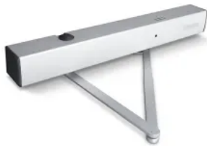
TS 4000 RFS – Gestängetürschließer mit elektrischer Freilauffunktion und Rauchschalter