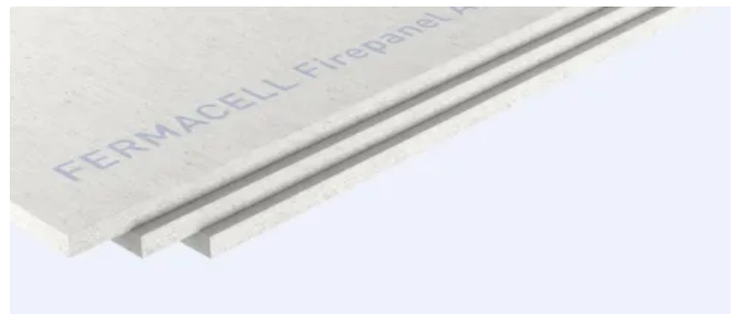
fermacell® Firepanel A1