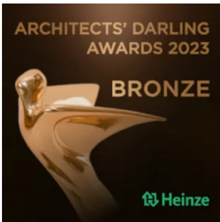
ARCHITECT'S DARLING AWARD 2023 WINDOWMENT® gewinnt Bronze in der Kategorie "Modulares / Serielles Bauen"