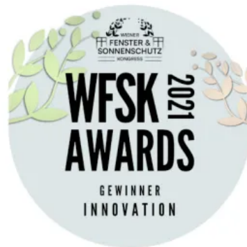
WFSK AWARDS 2021 1. Preis in der Kategorie Innovation. Ausgelobt von Interconnection Consulting im Rahmen des Wiener Fensterkongresses.