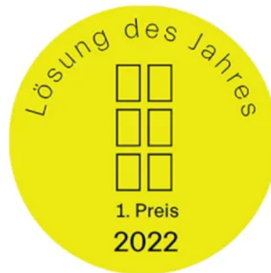
Award Wohnbauten des Jahres 2022 vom Callwey Verlag WINDOWMENT® gewinnt 1. Preis: Lösung des Jahres