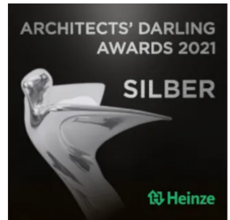
ARCHITECT'S DARLING AWARD 2021 WINDOWMENT® gewinnt Silber in der Kategorie "Modulares / Serielles Bauen"